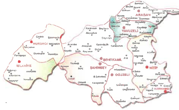
Gaziantep İlinin İlçeleri