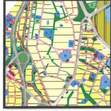
1/5.000 Ölçekli Mevcut Nazım İmar Planı