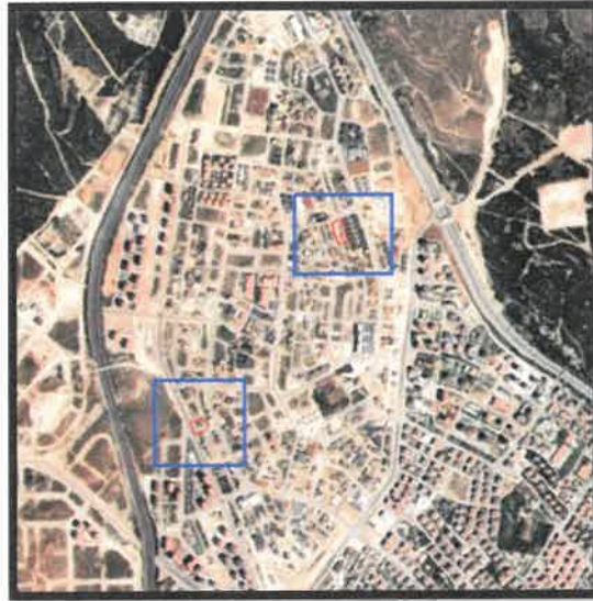
Planlama Alanının Konumu

Plan değişikliğine konu olan, İbrahimli Mahallesi N38-C4 ve N38C-12C, N38C-17A paftalarında bulunan alan Çevre yolu doğusunda bulunmaktadır.