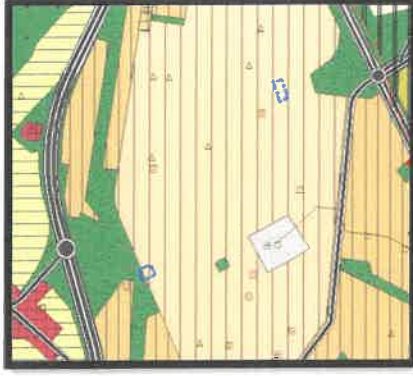
1/25.000 Ölçekli Mevcut Nazım İmar Planı