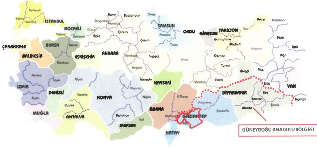
Gaziantep İlinin Türkiye İçindeki Konumu

Gaziantep, Güneydoğu Anadolu Bölgesi'nin en büyük ili olup nüfusu, ekonomik yapısı, turizm potansiyeli ve büyükşehir statüsü ile bir metropol şehirdir.