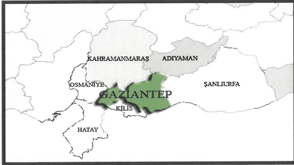
Gaziantep İlinin Bölge İçindeki Konumu

İlin doğusunda Şanlıurfa, batısında Osmaniye ve Hatay, kuzeyinde Kahramanmaraş, güneyinde Suriye, kuzeydoğusunda Adıyaman ve güneybatısında Kilis illeri bulunmaktadır.