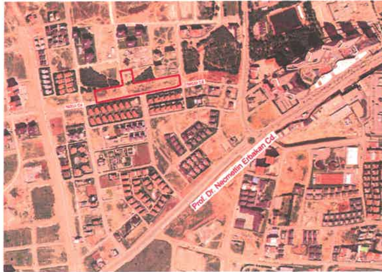
Şekil_2: Planlama alanının konumu.

Plan değişikliğine konu alan, Gaziantep ili, Şehitkamil İlçesi, 15 Temmuz Mahalle sınırları içerisinde, Prof. Dr. Necmettin Erbakan Caddesinin kuzey bölgesinde ve 56033 No'lu Caddenin kuzey sınırında yer almaktadır.