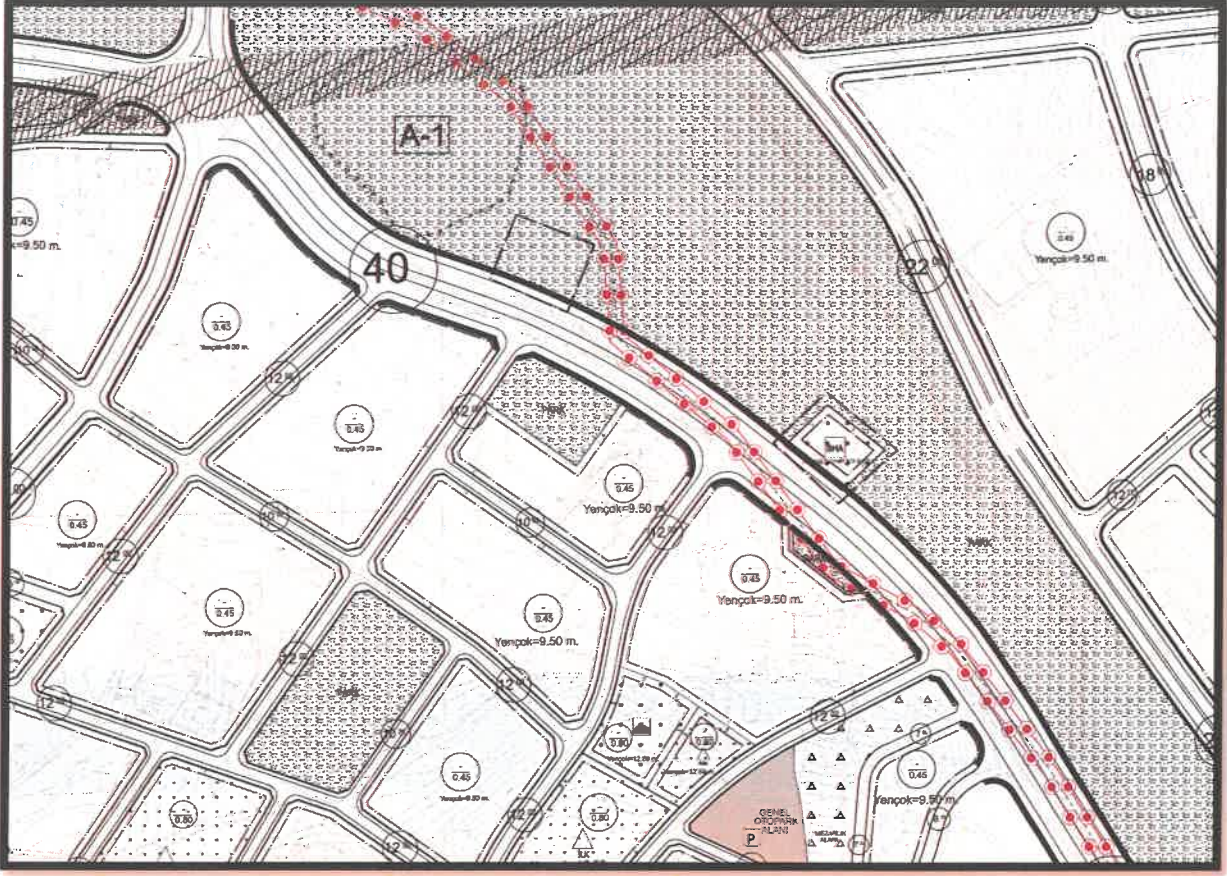
Şekil 2: Planlama Alanı Mevcut 1/1000 Uygulama İmar Planı