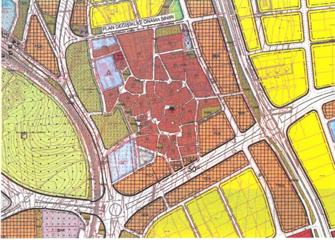
Şekil 3: Öneri 1/1000 Ölçekli Uygulama İmar Planı