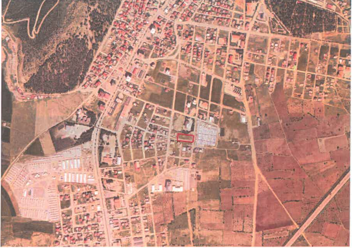
Şekil 1: Planlama Alanının Konumu

Planlama alanı İslahiye İlçesi, Fevziçakmak Mahallesi sınırları içerisinde Gaziantep-Antakya yolunun doğusunda, Nurten Öztürk Caddesinin güneyinde ve Şehit Zafer Yılmaz caddesinin batısında yer almaktadır.