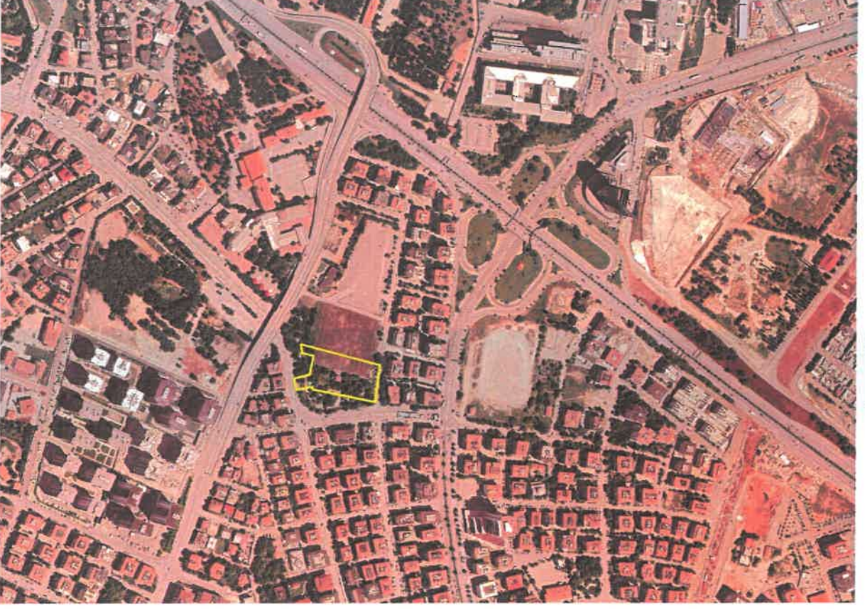
Şekil 1: Planlama Alanının Konumu

Planlama alanı Şehitkamil İlçesi, Pancarlı Mahallesi Tugay Köprülü Kavşağının kuzeybatısında, Adliye Tramvay İstasyonu kuzeyinde yer almaktadır.