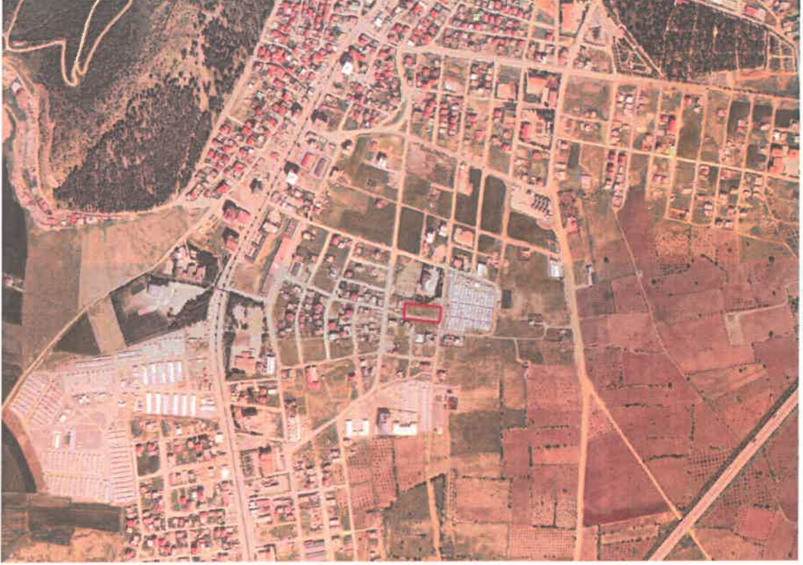
Şekil 1: Planlama Alanının Konumu

Planlama alanı İslahiye İlçesi, Fevziçakmak Mahallesi sınırları içerisinde Gaziantep-Antakya yolunun doğusunda, Nurten Öztürk Caddesinin güneyinde ve Şehit Zafer Yılmaz caddesinin batısında yer almaktadır.