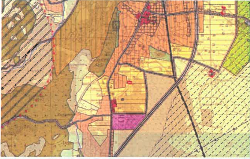
Şekil 2: Mevcut 1/25000 Ölçekli Nazım İmar Planı

Planlama alanı mevcut 1/25.000 ölçekli nazım imar planında konut alanı olarak görülmektedir.