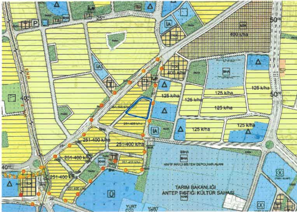
Şekil 2: Planlama Alanı Mevcut 1/5000 Ölçekli Nazım İmar Planı

Plan değişikliğine konu alan mevcut 1/5000 ölçekli nazım imar planında Yüksek Yoğunluklu Gelişme Konut Alanı (251-400 kişi/ha) olarak görülmektedir.