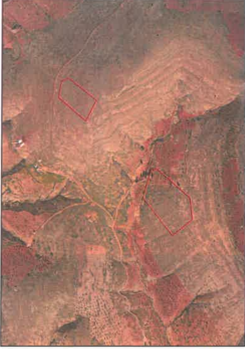
Şekil 1: Planlama Alanı Uydu Görüntüsü

Planlama alanı Gaziantep ili, Nizip İlçesi, Kızılcakent Mahallesi sınırları içerisinde, Nizip Fıstıkkent Planlama Bölgesi içerisinde yer almaktadır.