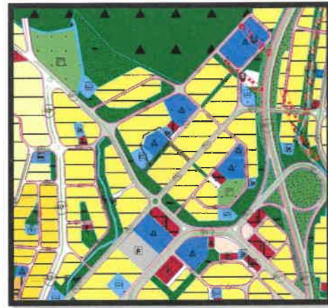
1/5.000 Ölçekli Öneri Nazım İmar Planı