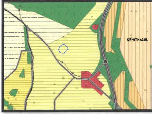
1/25.000 Ölçekli Mevcut Nazım İmar Planı