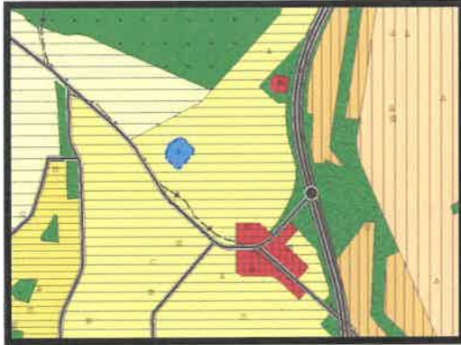
1/25.000 Ölçekli Öneri Nazım İmar Planı

Planlar arası kademeliği birlikteliğin sağlanabilmesi, kamu kaynaklarının etkin kullanılması, bölgede plan bütününde ve kentsel fiziki mekanda bütünlük ve sürekliliği sağlamak, artan nüfus yoğunluğu nedeniyle eğitim alanı ihtiyacının karşılanabilmesi amacıyla Eğitim Alanı olarak planlanması suretiyle 1/25.000 ve 1/5.000 ölçekli nazım imar planı değişikliği hazırlanmıştır.