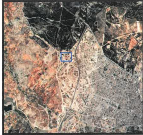
Planlama Alanının Konumu

Plan değişikliğine konu olan alan, Sancaktepe Mahallesi N38C-C4 ve N38C-12D paftalarında bulunan alan Çevre yolu batısında bulunmaktadır.