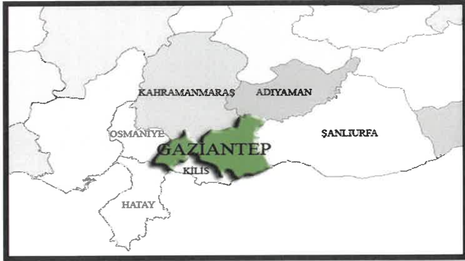
Gaziantep İlinin Bölge İçindeki Konumu

İlin doğusunda Şanlıurfa, batısında Osmaniye ve Hatay, kuzeyinde Kahramanmaraş, güneyinde Suriye, kuzeydoğusunda Adıyaman ve güneybatısında Kilis illeri bulunmaktadır.