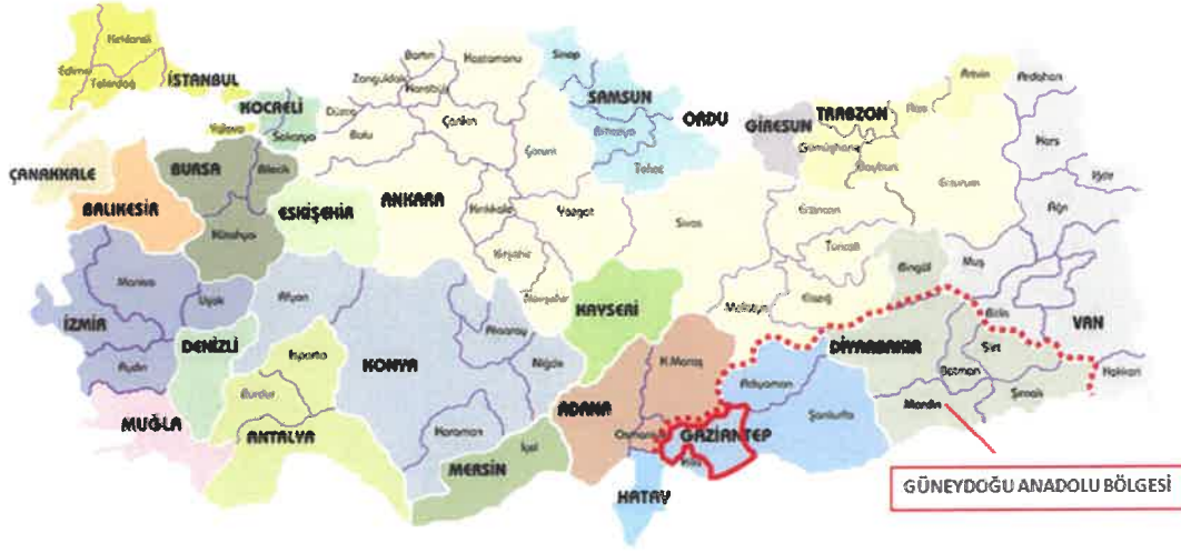
Gaziantep İlinin Türkiye İçindeki Konumu

Gaziantep, Güneydoğu Anadolu Bölgesi'nin en büyük ili olup nüfusu, ekonomik yapısı, turizm potansiyeli ve büyükşehir statüsü ile bir metropol şehirdir.