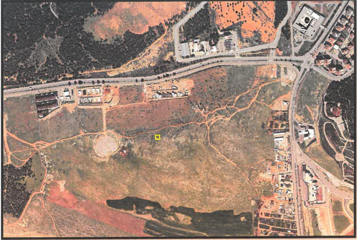
Şekil 1: Şahinbey İlçesi Çamtepe Mahallesi Planlama Alanı Konumu

Söz konusu planlama alanı, Gaziantep ili, Şahinbey İlçesi, Halep Bulvarı Kentsel Dönüşüm Gelişim Proje Alanı sınırları Çamtepe Mahallesi içerisinde bulunmaktadır.