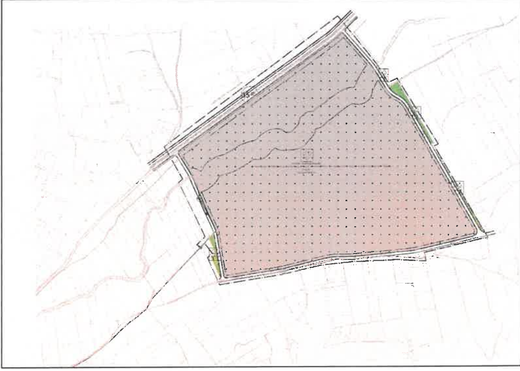
Şekil 3: Öneri 1/1000 Ölçekli Uygulama İmar Planı