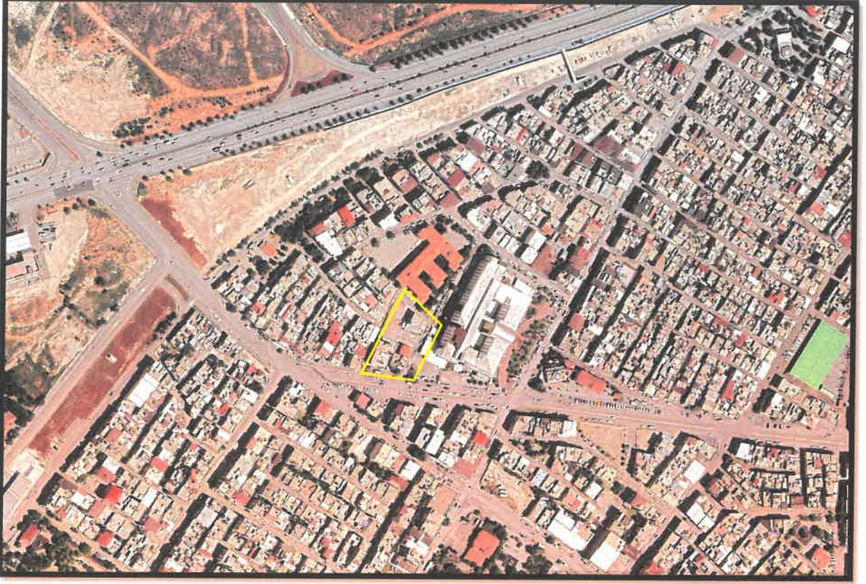
Şekil 1: Şhitkamil İlçesi Özgürlük Mahallesi Planlama Alanı Konumu

Söz konusu planlama alanı Gaziantep İli, Şhitkamil İlçesi Özgürlük Mahallesi içerisinde bulunmaktadır.