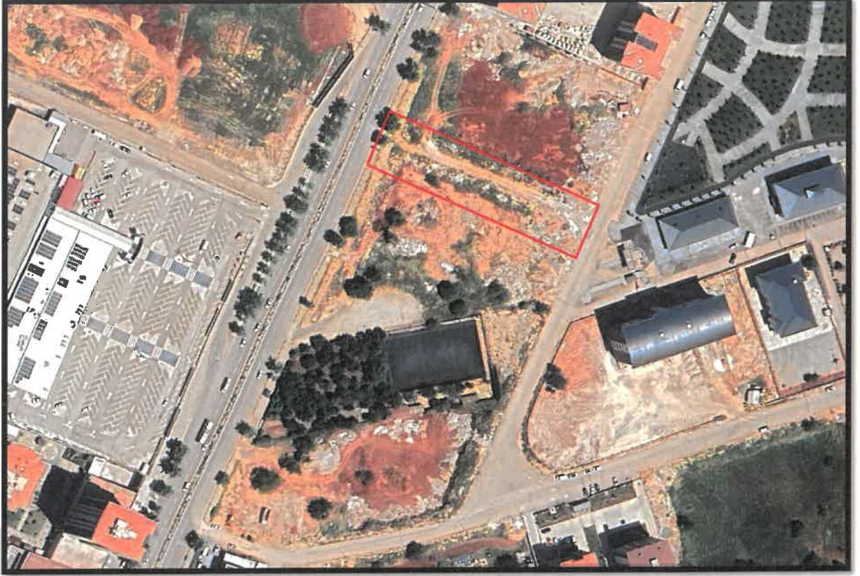
Şekil 1: Şhitkamil İlçesi Pancarlı Mahallesi Planlama Alanı Konumu

Planlama bölgesi, Şhitkamil İlçesi Pancarlı Mahallesi Abdülkadir Aksu Bulvarı üzerinde yer almaktadır.