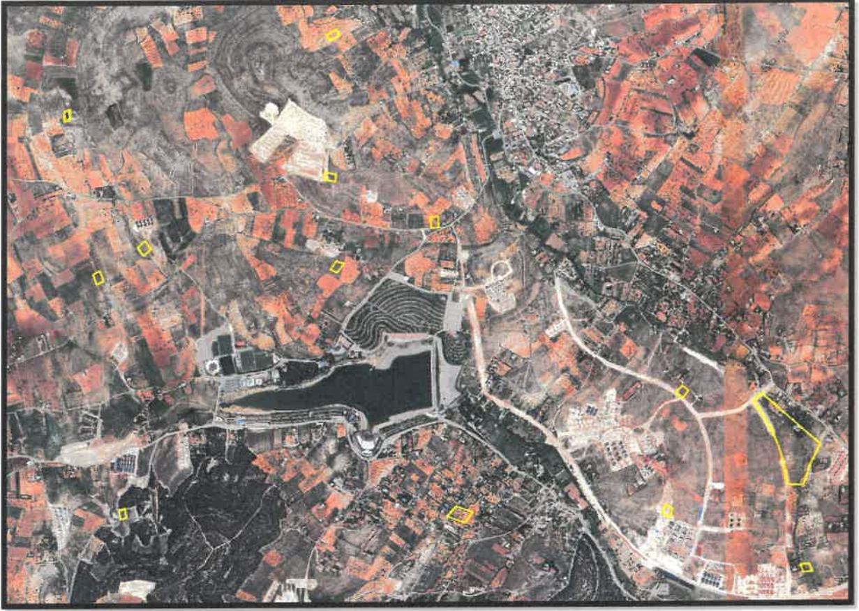
Şekil 1: Şahinbey İlçesi Sarsalkım ve Gerciğin Mahalleleri Planlama Alanı Konumu

Söz konusu planlama alanları Gaziantep İli, Şahinbey İlçesi Sarsalkım ve Gerciğin Mahalleleri içerisinde bulunmaktadır.