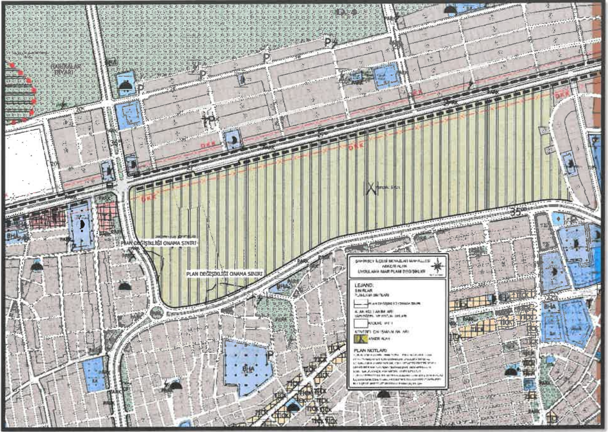
Şekil 3: Planlama Alanı Öneri 1/1000 Ölçekli Uygulama İmar Planı