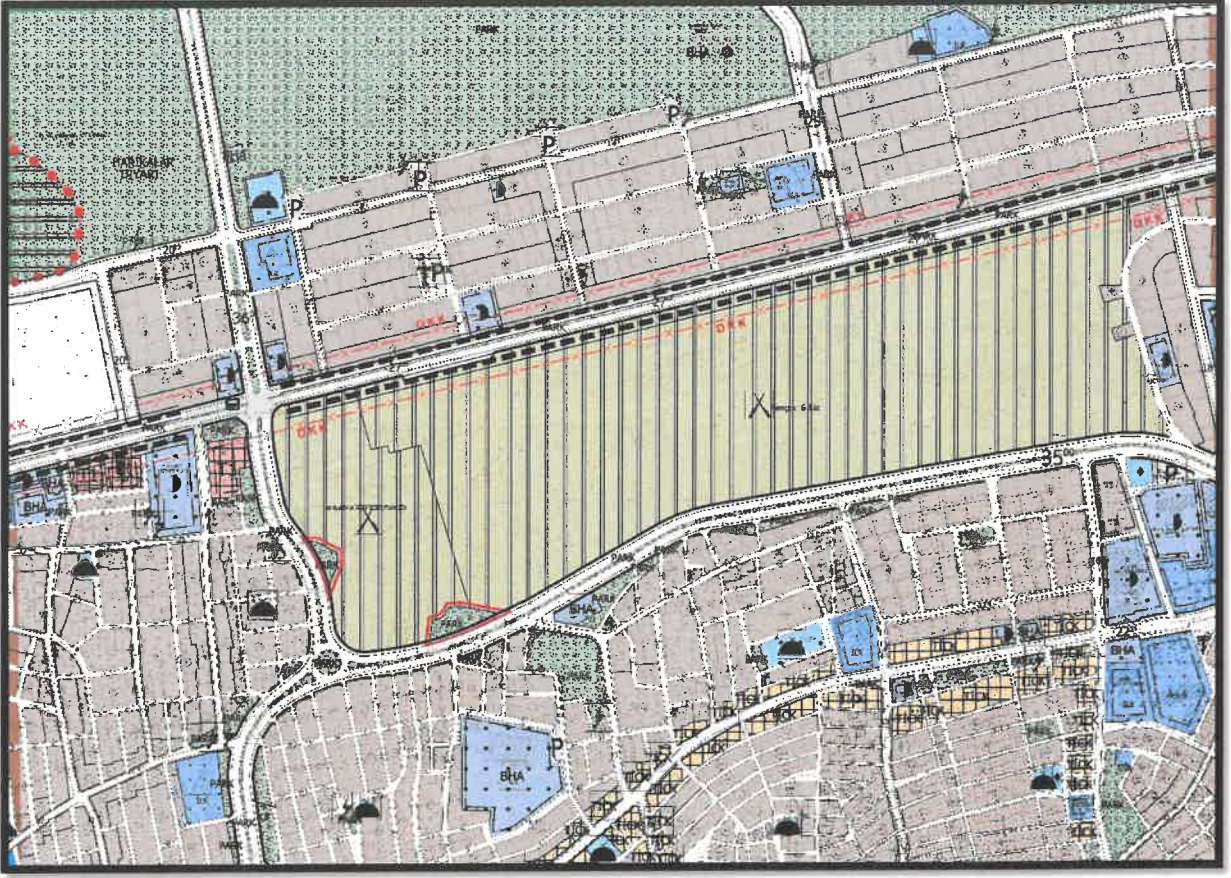
Şekil 2: Planlama Alanı Mevcut 1/1000 Ölçekli Uygulama İmar Planı