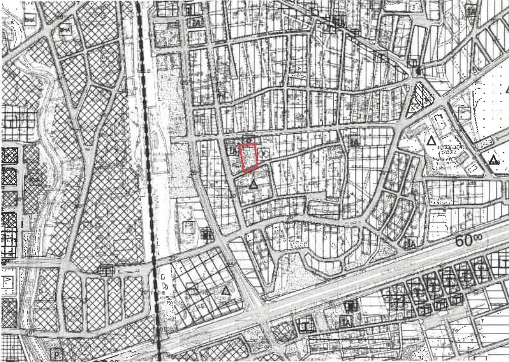
Şekil 2: Planlama Alanı Mevcut 1/5000 Ölçekli Nazım İmar Planı

Plan değişikliğine konu alan mevcut 1/5000 ölçekli nazım imar planında Park Alanı olarak görülmektedir.