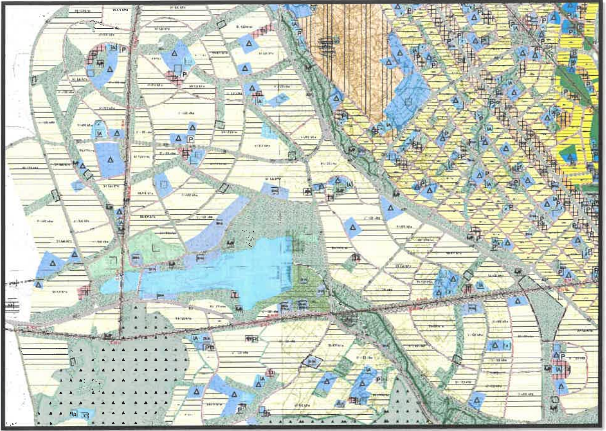
Şekil 3: Şahinbey İlçesi Sarısalıkm ve Gercifin Mahalleleri Planlama Alanı Mevcut 1/5000 Ölçekli Nazım İmar Planı