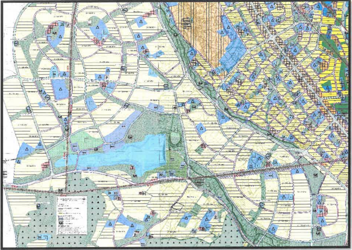
Şekil 5: Şahinbey İlçesi Sarısalıkım ve Gercişin Mahalleleri Planlama Alanı Öneri 1/5000 Ölçekli Nazım İmar Planı

3-) BELİRTİLMİYEN HUSUSLARDA 3194 SAYILI İMAR KANUNU İLE BU KANUNA GÖRE ÇIKARILAN YÖNETMELİKLER İLE GAZİANTEP BÜYÜKŞEHİR BELEDİYESİ İMAR YÖNETMELİĞİ HÜKÜMLERİNE UYULACAKTIR.