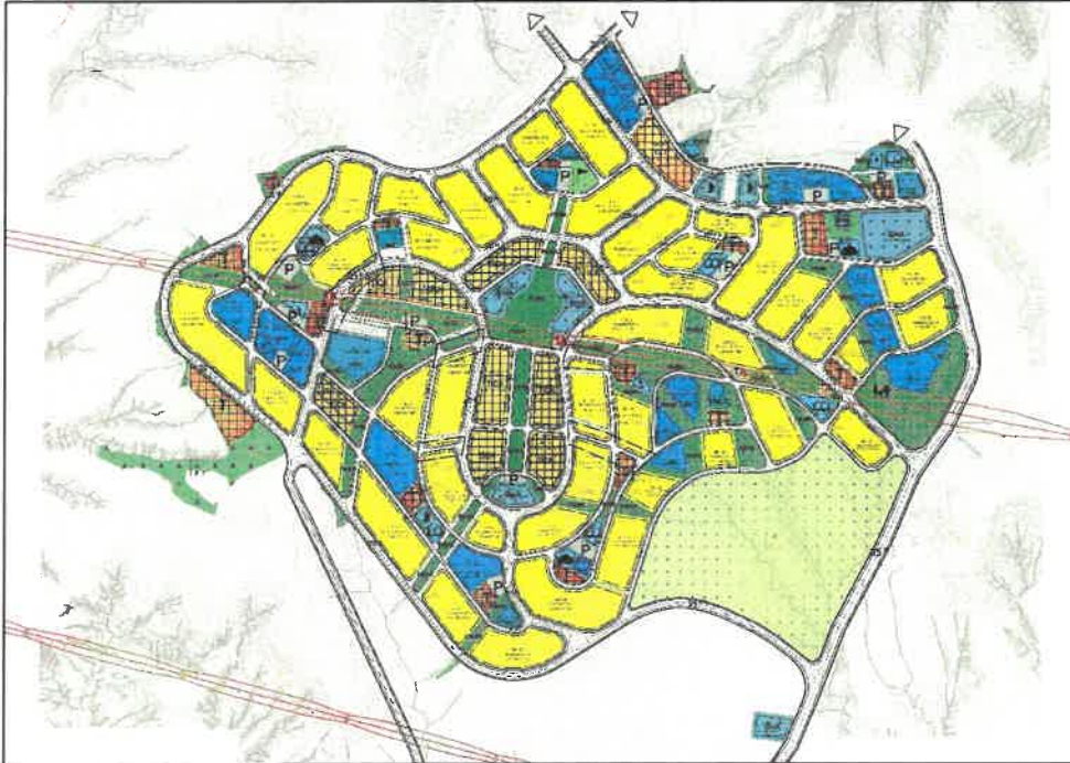
Şekil 2: Planlama Alanı Mevcut 1/1000 Ölçekli Uygulama İmar Planı

Planlama alanları mevcut uygulama imar planında ise imar adaları ve imar yolu olarak görülmektedir