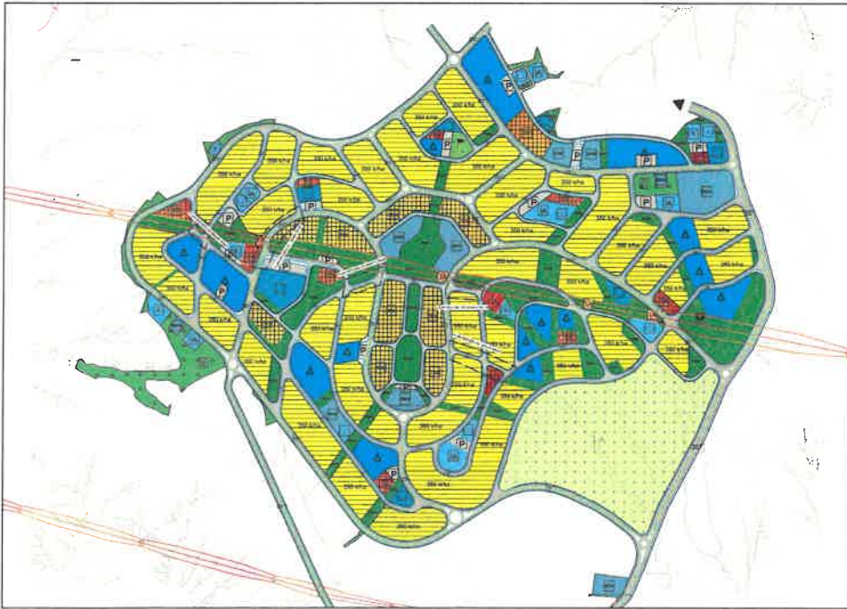
Şekil 2: Planlama Alanı Mevcut 1/5000 Ölçekli Nazım İmar Planı

Plan değişikliğine konu alanlar mevcut nazım imar planında imar adaları ve imar yolu olarak görülmektedir.