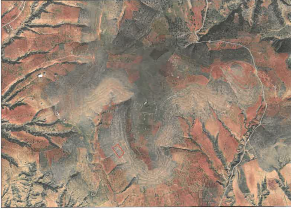
Şekil 1: Planlama Alanı Uydu Görüntüsü

Planlama alanı Gaziantep ili, Nizip İlçesi, Kızılcakent Mahallesi sınırları içerisinde, Nizip Fıstikkent Planlama Bölgesi içerisinde yer almaktadır.