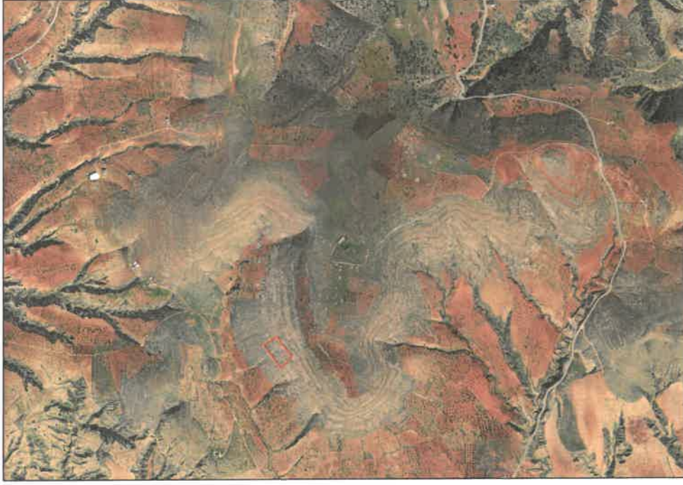
Şekil 1: Planlama Alanı Uydu Görüntüsü

Planlama alanı Gaziantep ili, Nizip İlçesi, Kızılcakent Mahallesi sınırları içerisinde, Nizip Fıstıkkent Planlama Bölgesi içerisinde yer almaktadır.