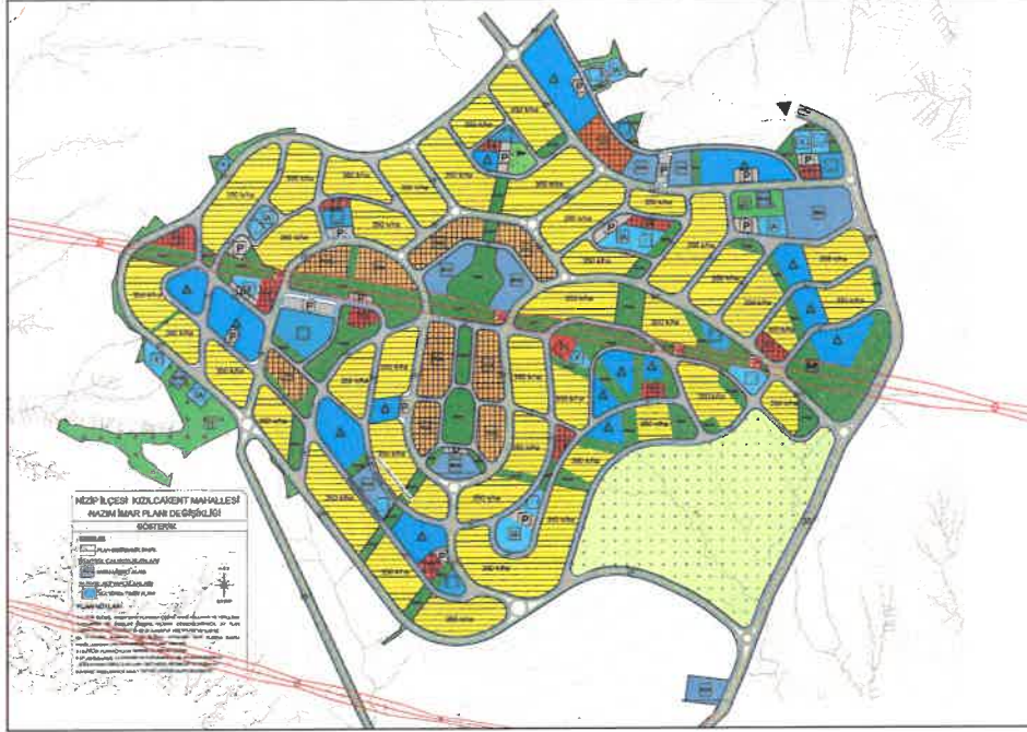
Şekil 3: 1/5000 Ölçekli Nazım İmar Planı Değişikliği

Nizip İlçesi Kızılcakent Mahallelerinde plan değişikliğine konu alan mevcut uygulama imar planında Kültürel Tesis Alanı ve Açık Otopark Alanı olarak görülmektedir. Söz konusu alan içerisinde resmi kurumların ihtiyacı olan lojman gereksinimini karşılamak üzere Uydu Kentin güneyinde yer alan Kültürel Tesis Alanı, Kamu Hizmet Alanı (Kamu Lojman Alanı) olarak düzenlenerek söz konusu Kültürel Tesis Alanının doğusundaki Açık Otopark Alanı eşdeğer Kültürel Tesis Alanı olarak planlanmıştır. Söz konusu plan değişiklikleri Mekansal Planlar Yapım Yönetmeliği'ne uygun olarak hazırlanmıştır.