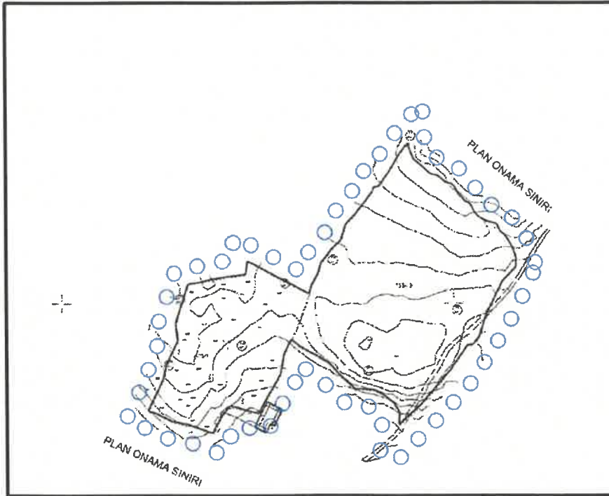
Harita 3: Planlama Alanı 1/5.000 Mer'î İmar Planı

Planlama alanı ve yakın çevresinde 1/5.000 ölçekli nazım imar planı bulunmamaktadır (Harita 3).