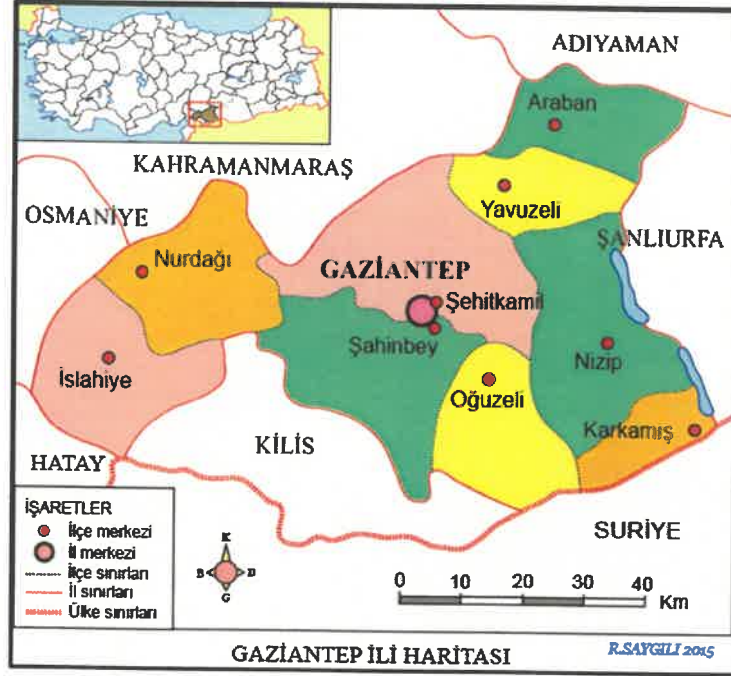
Harita 1: Planlama Alanının Bölgesindeki Yeri

Planlama alanının bulunduğu Şehitkâmil ilçesi kuzeyinde Pazarcık, kuzeydoğusunda Yavuzeli İlçesi, doğusunda Nizip İlçesi, güneydoğusunda Oğuzeli İlçesi, güneyinde Şahinbey İlçesi, batısında ise Nurdağı İlçesi ile sınırlıdır (Harita 1).