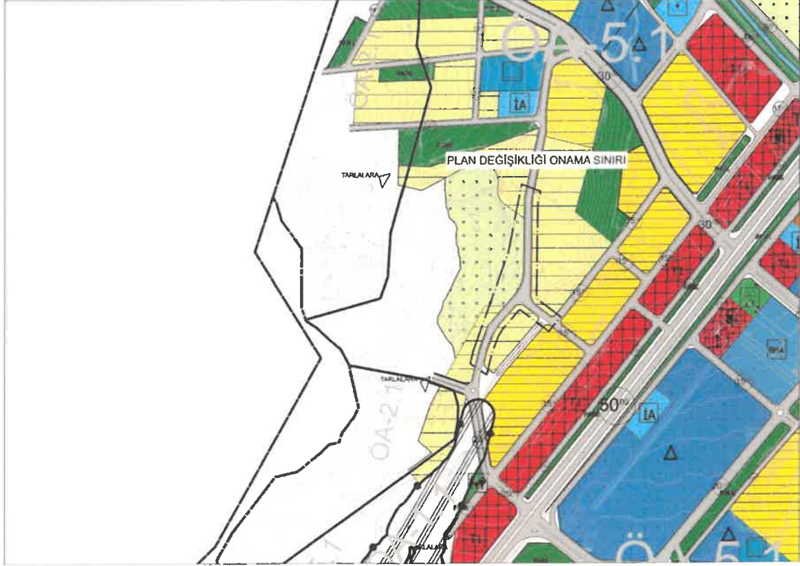
Şekil 3: Öneri 1/5000 Ölçekli Nazım İmar Planı