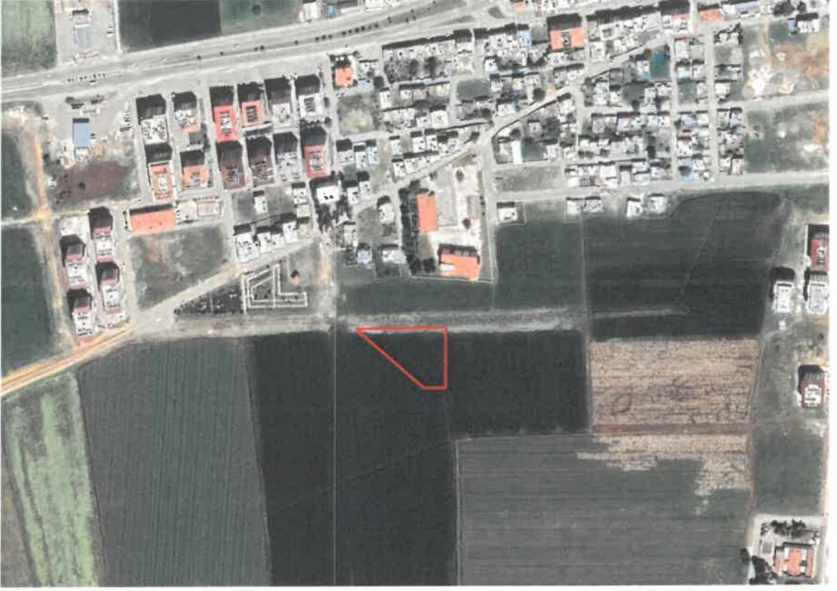
Şekil 1: Planlama Alanının Konumu

Planlama alanı Araban İlçesi, Turgut Özal Mahallesi sınırları içerisinde Turgut Özal Parkı ve Gaziantep-Adıyaman yolunun güneyinde yer almaktadır.