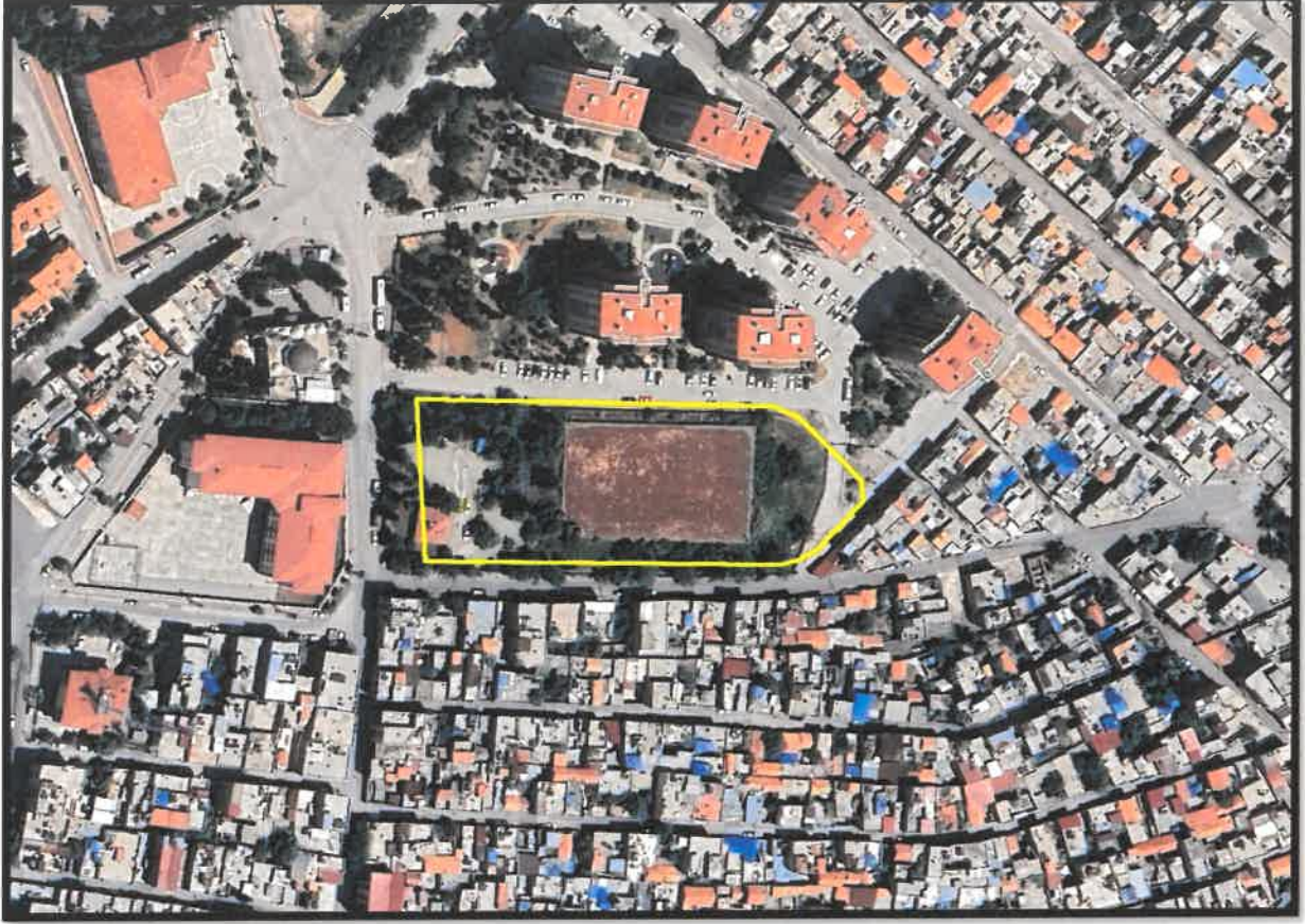
Şekil 1: Planlama Alanı Konumu

Planlama alanı Şahinbey İlçesi, Çamlıca Mahallesi sınırları içerisinde yer almaktadır.