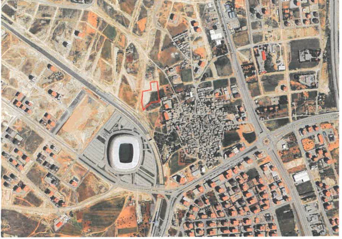
Şekil 1: Planlama Alanının Konumu

Planlama alanı Şehitkâmil İlçesi, Beylerbeyi Mahallesi sınırları içerisinde Kalyon Stadyumunun kuzeydoğusunda ve Gaziantep-Adıyaman yolunun batısında yer almaktadır.