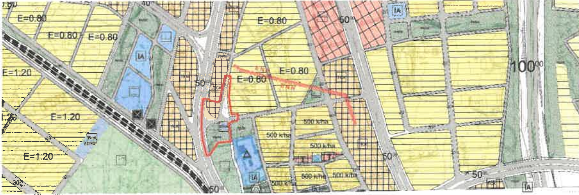
Şekil 3: Mevcut 1/5000 Ölçekli Nazım İmar Planı

Planlama alanı mevcut 1/5.000 ölçekli nazım imar planında park, ticaret+konut, büyükşehir belediyesi hizmet alanı olarak görülmektedir