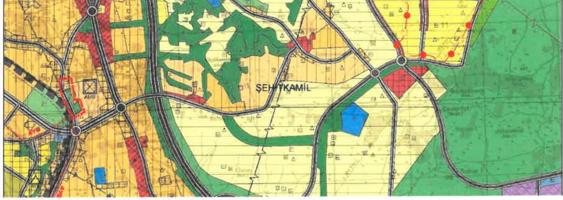
Şekil 2: Mevcut 1/25000 Ölçekli Nazım İmar Planı

Planlama alanı mevcut 1/25.000 ölçekli nazım imar planında konut, ağaçlandırılacak alan ve ticaret+konut alanı olarak görülmektedir.