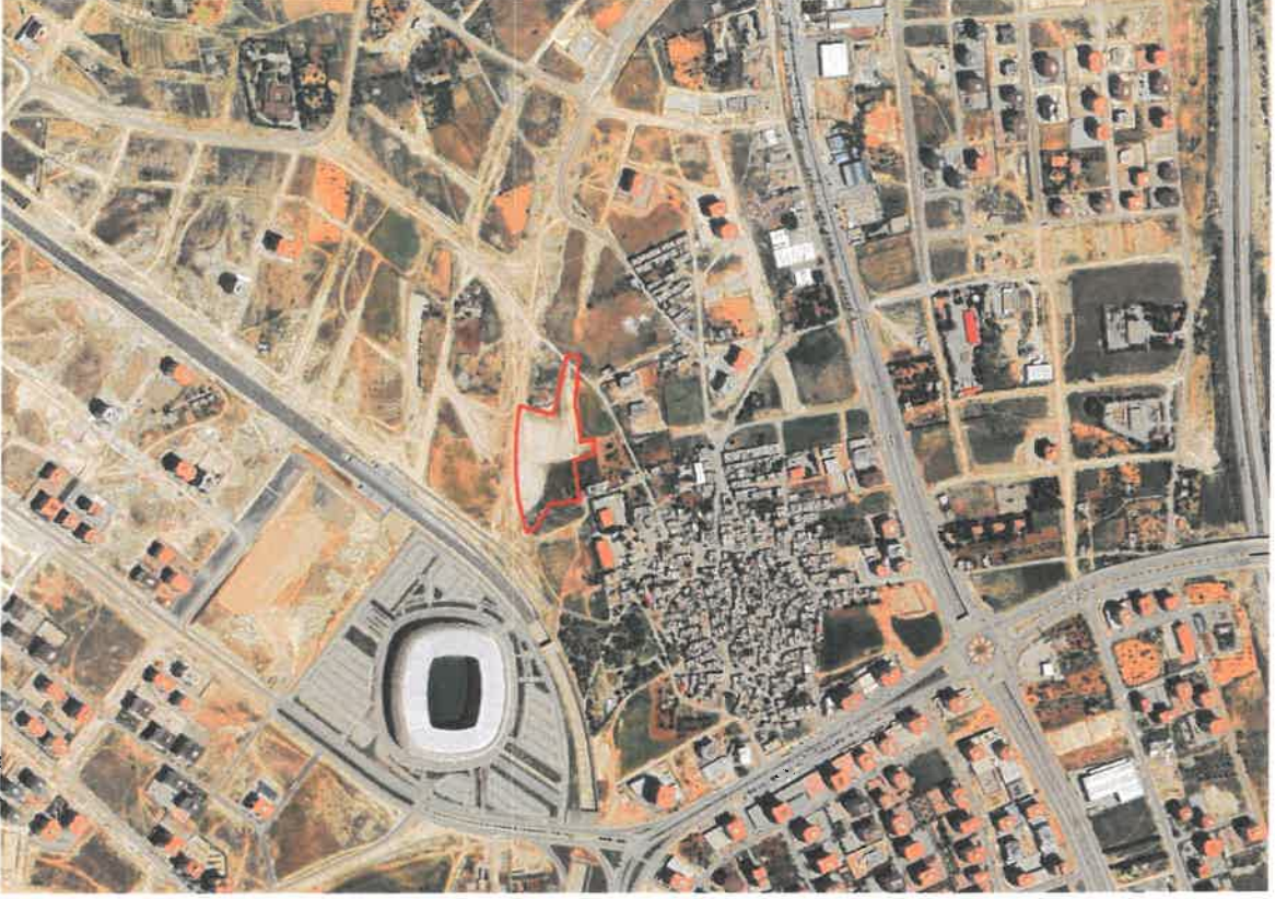
Şekil 1: Planlama Alanının Konumu

Planlama alanı Şehitkâmil İlçesi, Beylerbeyi Mahallesi sınırları içerisinde Kalyon Stadyumunun kuzeydoğusunda ve Gaziantep-Adıyaman yolunun batısında yer almaktadır.