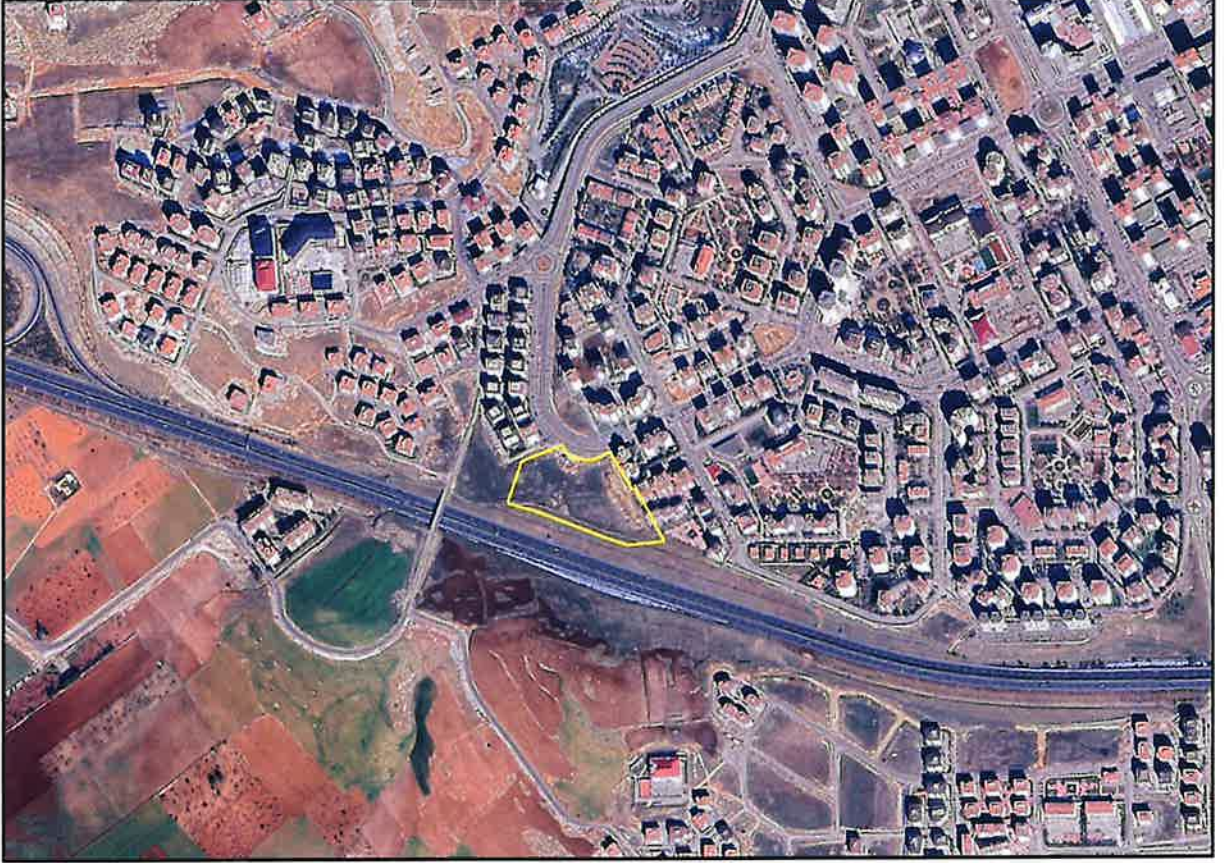
Şekil 1: Proje Alanının Kent İçerisindeki Konumu

1/5000 ölçekli nazım imar plan değişikliğine konu alan Şahintepe Mahallesi sınırı içerisinde kentin güneyinden geçen çevre yolunun kuzeyinde, Şahinbey Parkı'nın güneyinde, 133396 Nolu cadde ile 133390 Nolu caddenin kesiştiği alanda yer almaktadır.