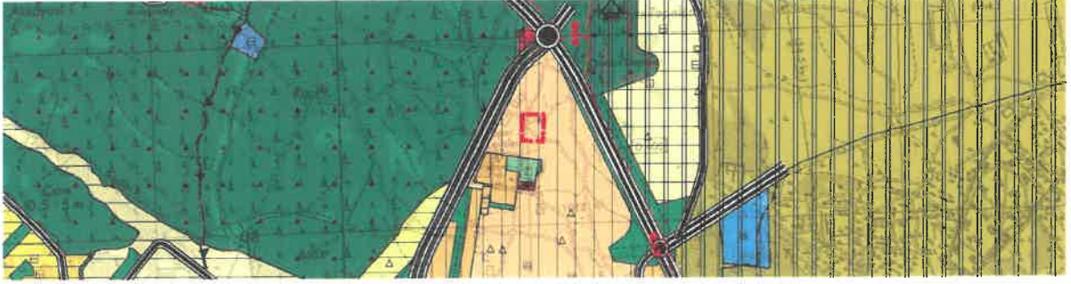
Şekil 2: Mevcut 1/25000 Ölçekli Nazım İmar Planı

Planlama alanı mevcut 1/25.000 ölçekli nazım imar planında konut alanı olarak görülmektedir.