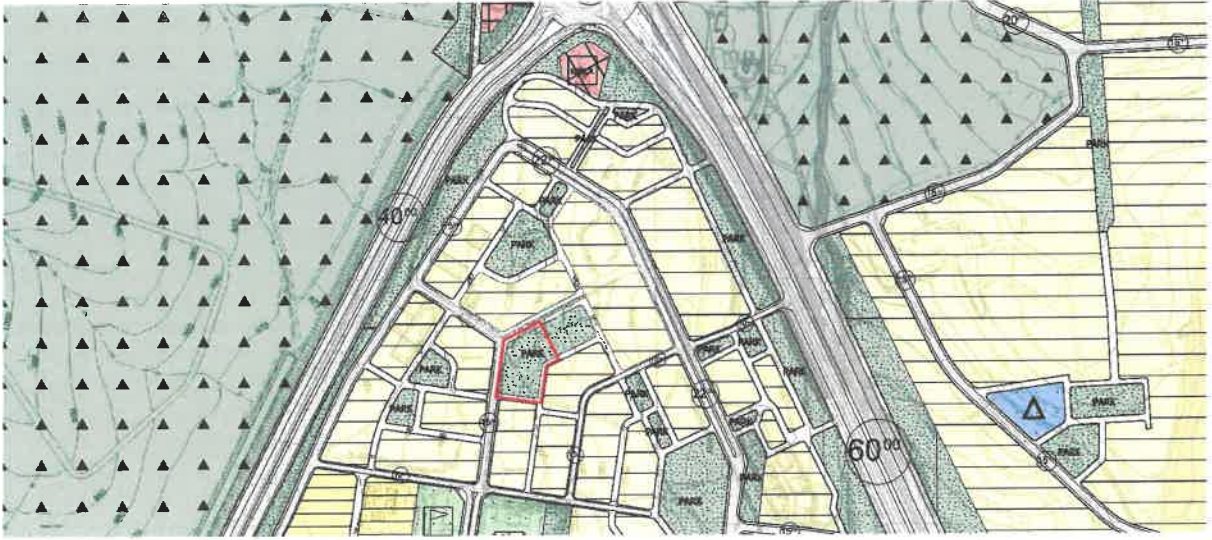
Şekil 3: Mevcut 1/5000 Ölçekli Nazım İmar Planı

Planlama alanı mevcut 1/5.000 ölçekli nazım imar planında park alanı olarak görülmektedir.