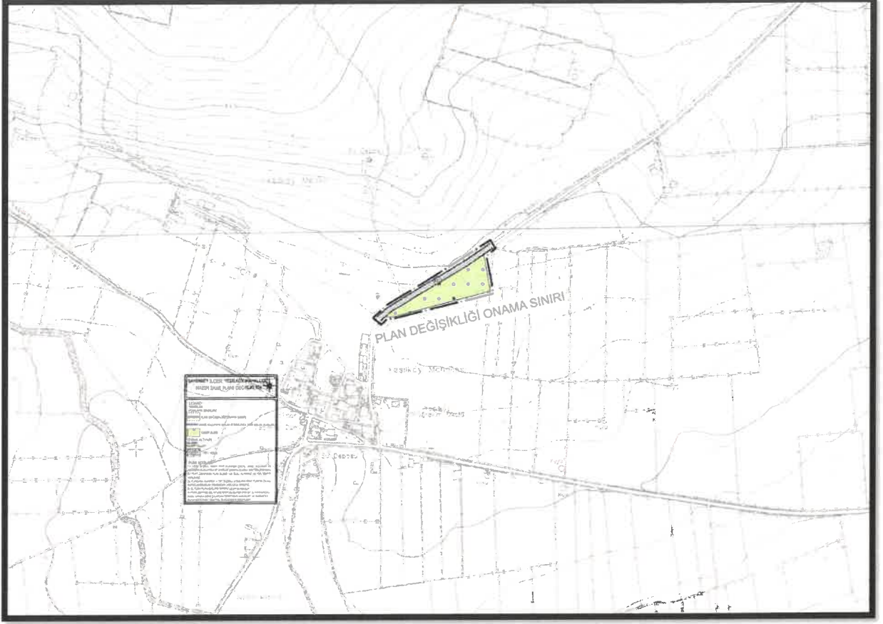
Şekil 3: Planlama Alanı Öneri 1/5000 Ölçekli Nazım İmar Planı