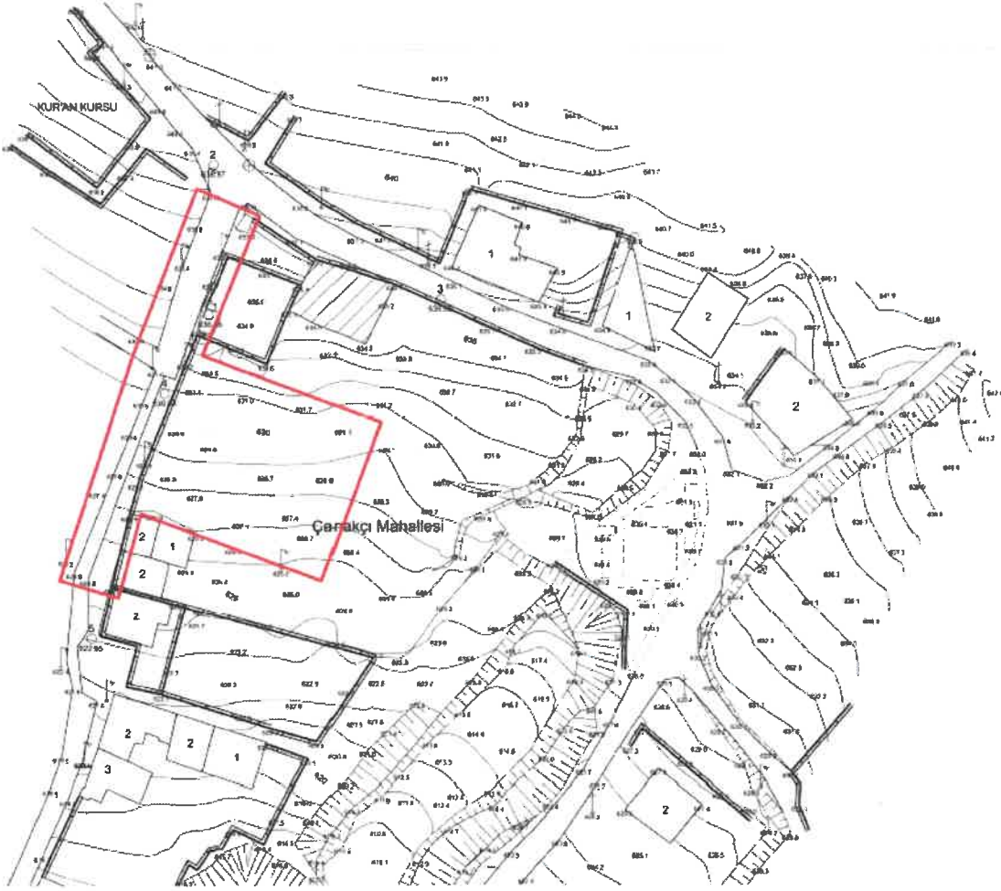
Şekil 2: Planlama Alanı Mevcut 1/1000 Ölçekli Uygulama İmar Planı

Plan değişikliğine konu alan, mevcut 1/1000 Ölçekli Uygulama İmar Planında plansız alan olarak görülmektedir.