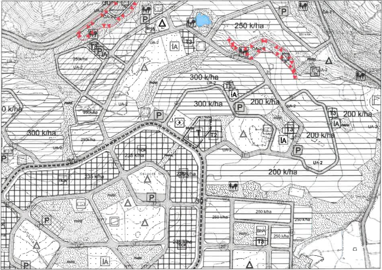
Şekil 3: Planlama Alanı Öneri 1/5000 Nazım İmar Planı