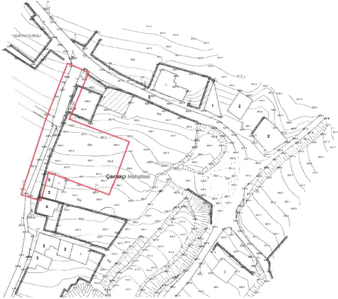
Şekil 2: Planlama Alanı Mevcut 1/5000 Ölçekli Nazım İmar Planı

Plan değişikliğine konu alan, mevcut 1/5000 Ölçekli Nazım İmar Planında plansız alan olarak görülmektedir.