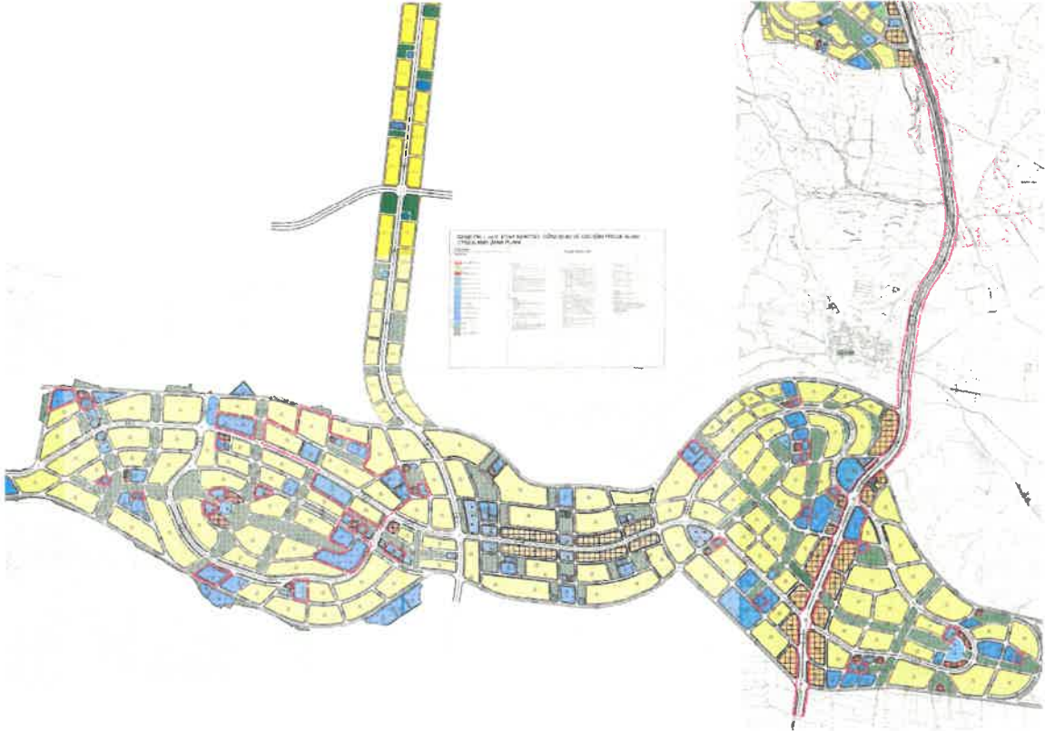
Şekil_4: Öneri 1/1000 uygulama imar planı