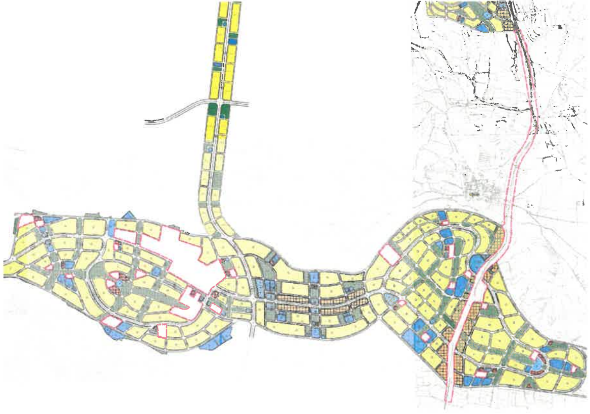
Şekil_3: Mevcut 1/1000 ölçekli uygulama imar planı