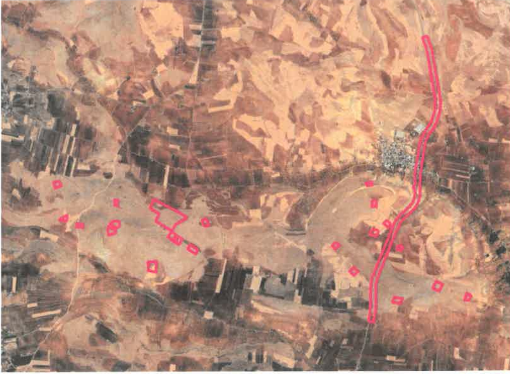
Şekil_2: Planlama alanının konumu.

Planlama alanı; Gaziantep'in güneyinde, Şahinbey ilçesi sınırları içerisinde, Geneyik Mahalle merkezinin güney ve güneybatısında yer almaktadır.