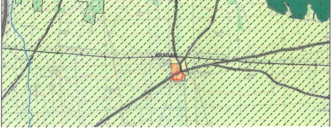
Şekil 2: Mevcut 1/25000 Ölçekli Nazım İmar Planı

Planlama alanı mevcut 1/25.000 ölçekli nazım imar planında konut alanı olarak görülmektedir.