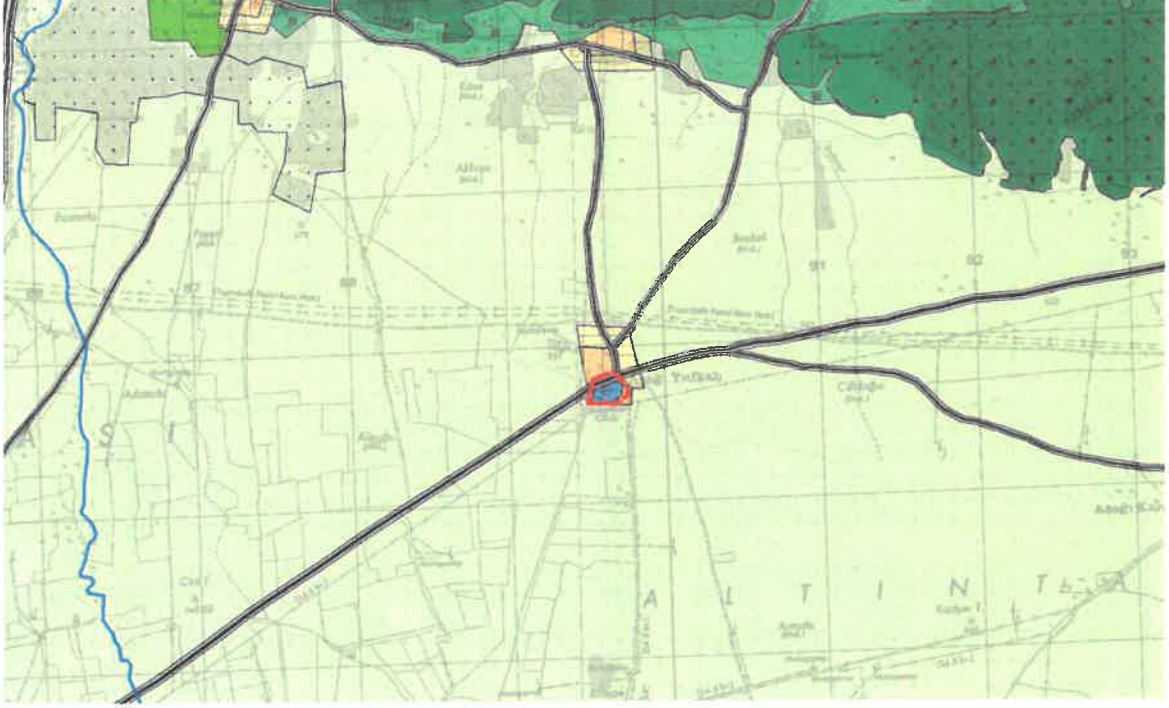
Şekil 4: Öneri 1/25000 Ölçekli Nazım İmar Planı