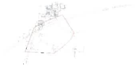
Şekil 3: Mevcut 1/5000 Ölçekli Nazım İmar Planı

Planlama alanı mevcut 1/5.000 ölçekli nazım imar planında plansız alan olarak görülmektedir.