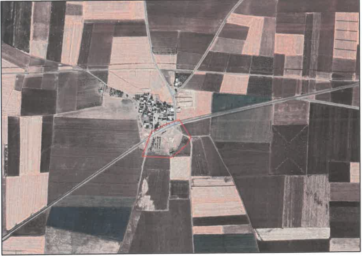
Şekil 1: Planlama Alanının Konumu

Planlama alanı Araban İlçesi Aşğıyufkalı Mahallesi sınırları içerisinde ve Aşğıyufkalı köy yolunun güneyinde kalmaktadır.