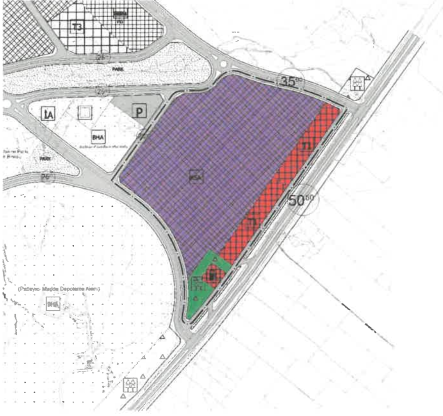
Şekil 5: Öneri 1/5000 Ölçekli Nazım İmar Planı