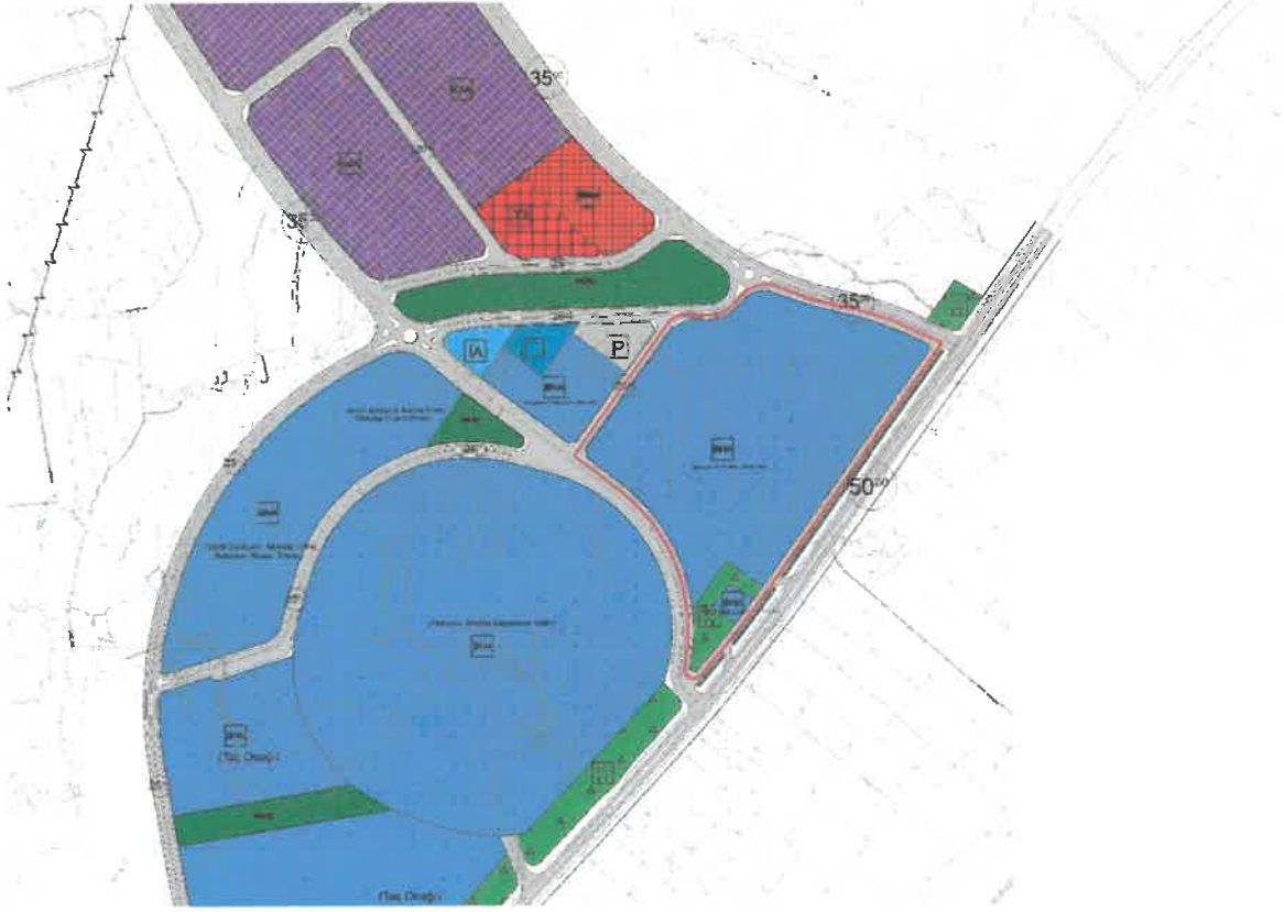
Şekil 3: Mevcut 1/5000 Ölçekli Nazım İmar Planı

Bahse konu alan mevcut 1/5000 ölçekli nazım imar planında belediye hizmet alanı, ağaçlandırılacak alan olarak görülmektedir.