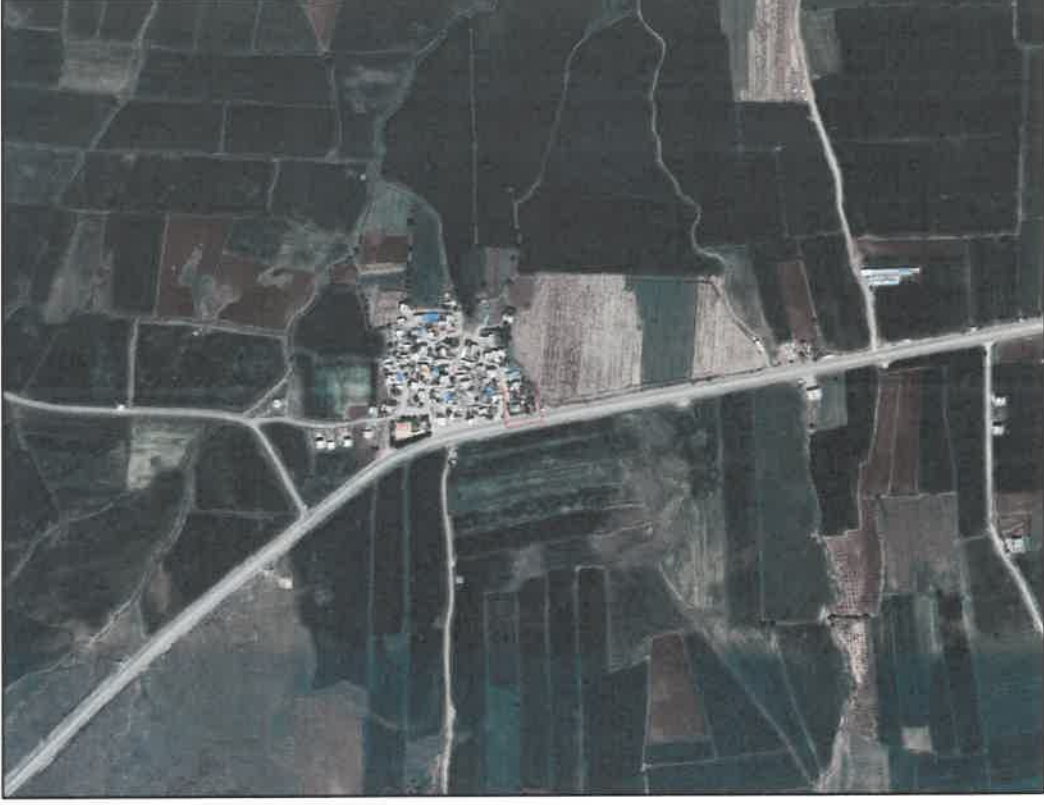
Şekil 1: Planlama Alanının Konumu

Planlama alanı Araban İlçesi Gelinbuğday Mahallesi sınırları içerisinde Gelinbuğday İlkokulunun doğusunda, Gaziantep-Adıyaman Yolunun kuzeyinde yer almaktadır.