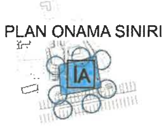
Şekil 3: Öneri 1/5000 Ölçekli Nazım İmar Planı