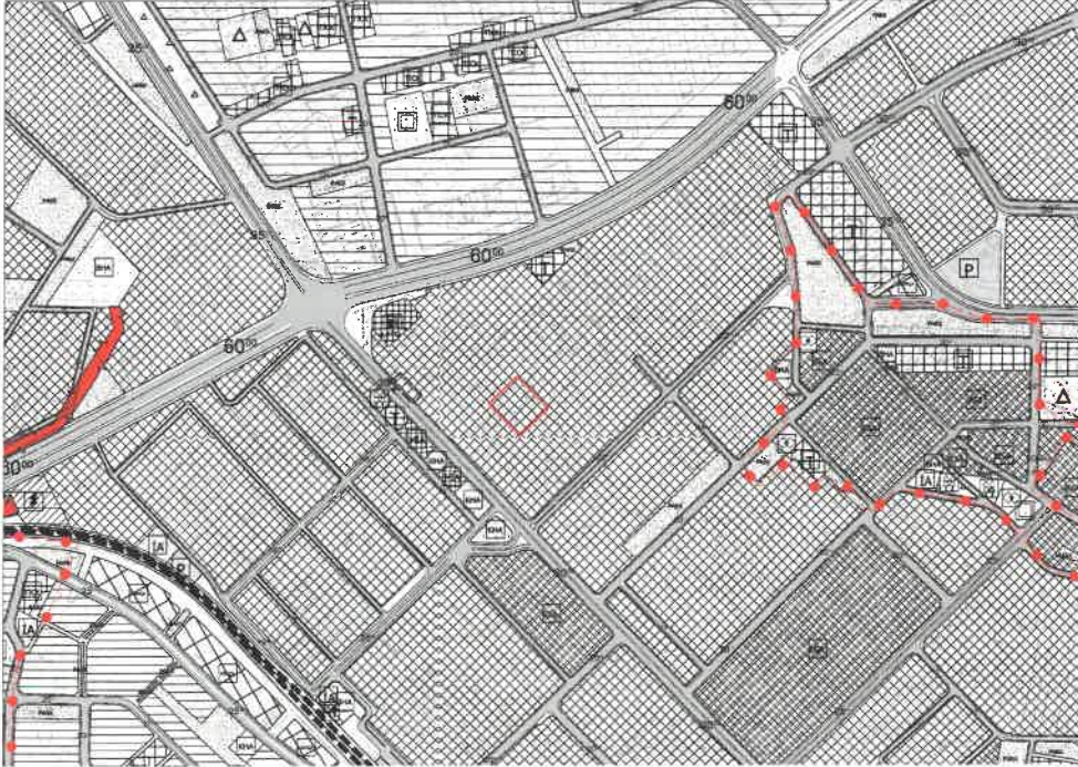
Şekil 2: Planlama Alanı Mevcut 1/5000 Ölçekli Nazım İmar Planı

Planlama alanı yürürlükteki 1/5000 ölçekli nazım imar planında sanayi alanı olarak görülmektedir.