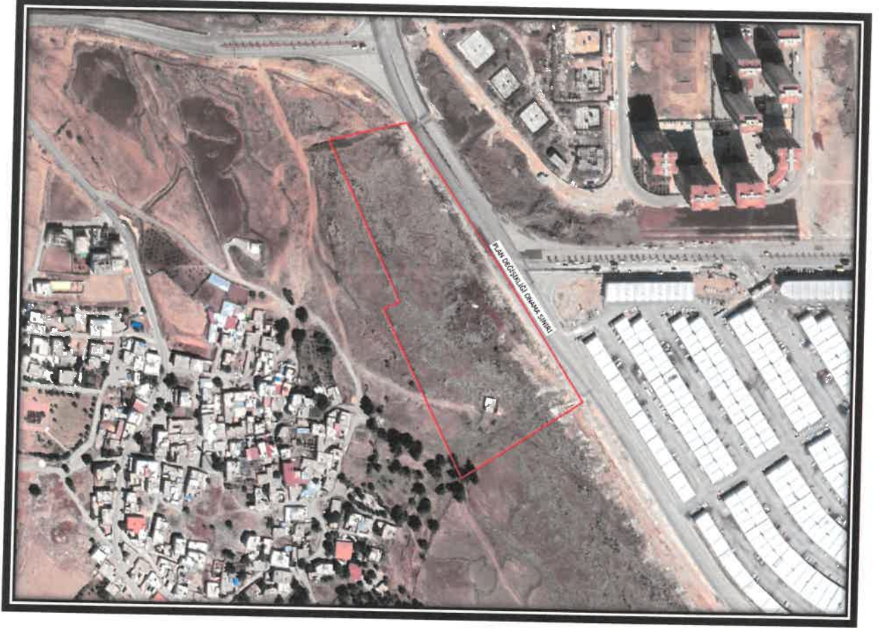
Şekil 1: Planlama Alanı Konumu

Gaziantep ili, Şahinbey İlçesi, Bağlarbaşı Mahallesi sınırları içerisinde bulunan planlama alanı, Gaziantep Çevre Yolu'nun güneyinde, Mavikent Sanayi Sitesi'nin kuzeybatısında yer almaktadır.