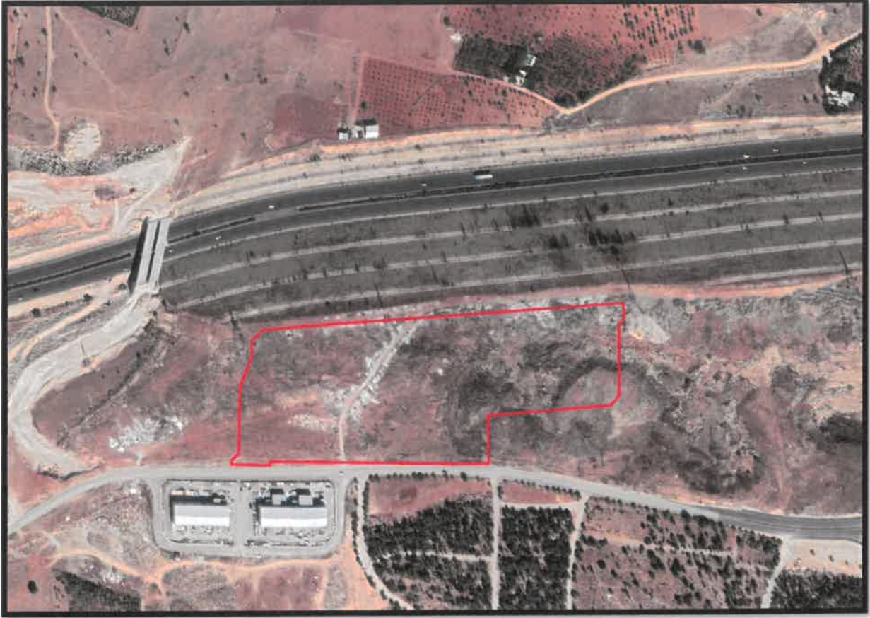
řekil 1: Planlama Alanı Konumu

Plan deęiřiklięine konu alan řahinbey İlęesi, Yeřilkent Mahallesi sınırları ięerisinde, Yeřilkent mezarlıęının kuzeybatısında, evre Otoyolunun gneyinde yer almaktadır.