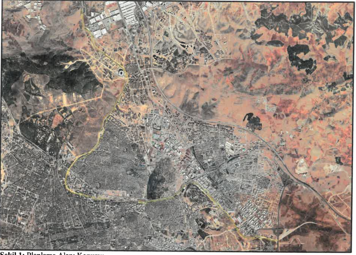
Şekil 1: Planlama Alanı Konumu

Plan deęişikliğine konu alanlar Gaziantep İli Şehitkâmil İlçesi muhtelif mahalle sınırları içerisinde dir.