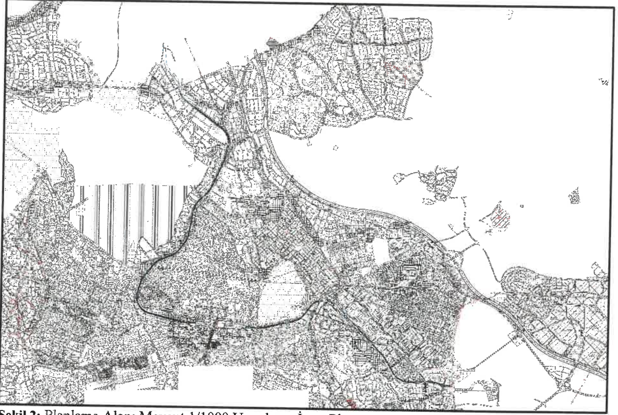
Şekil 2: Planlama Alanı Mevcut 1/1000 Uygulama İmar Planı

Şehitkâmil İlçesi Muhtelif Mahallelerde Gaziray Banliyo hattı ve çevresinde yer alan plan değişikliğine konu alanlar 1/1000 Ölçekli Uygulama İmar Planında Konut Alanları, Kentsel Çalışma Alanları, Sosyal Altyapı Alanları, Teknik Altyapı, Açık Ve Yeşil Alanlar, Demiryolu Koruma Kuşağı, Demiryolu Etkileşim Bandı, Raylı Toplu Taşıma İstasyonu, Raylı Toplu Taşıma Hattı, Hızlı Tren Hattı ve İmar Yolu olarak görülmektedir.