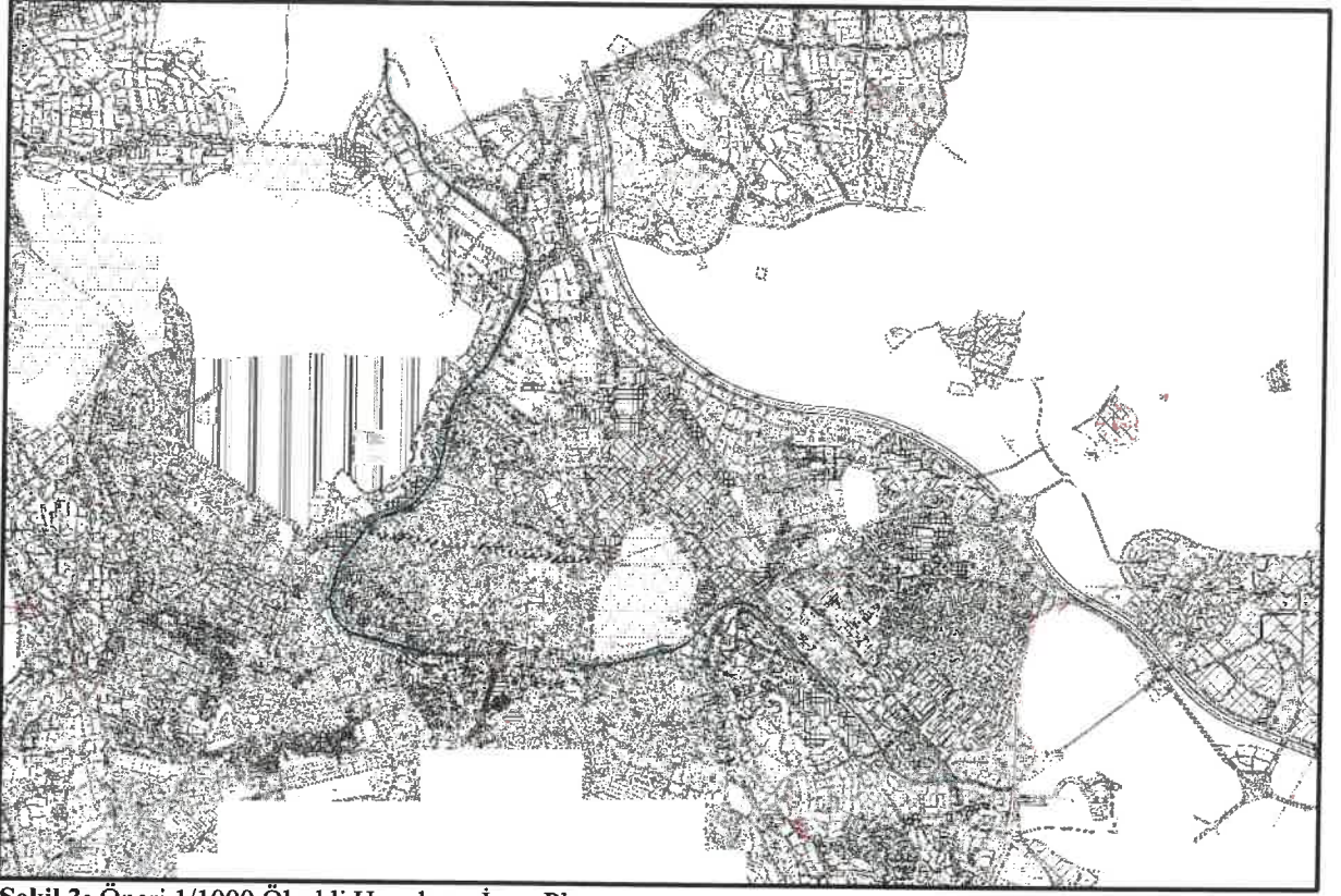
Şekil 3: Öneri 1/1000 Ölçekli Uygulama İmar Planı