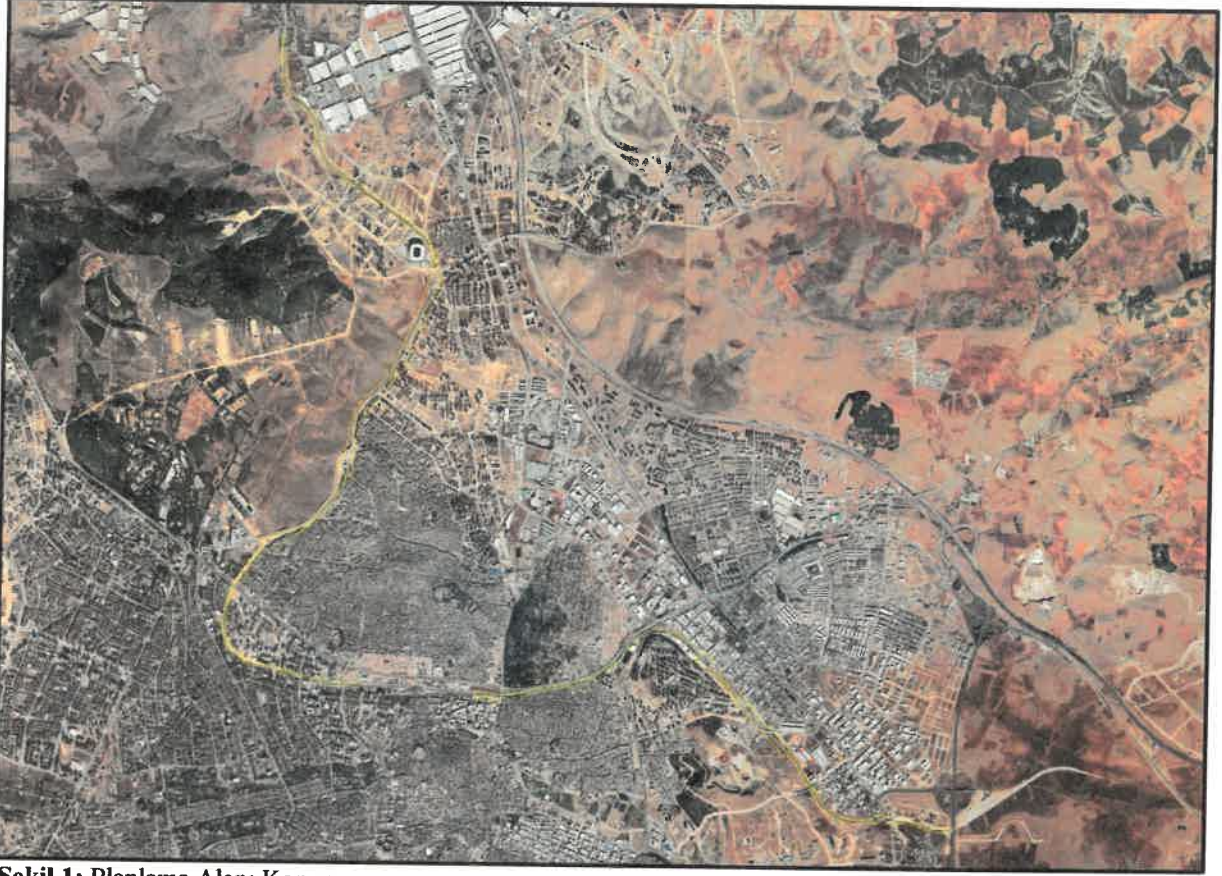
řekil 1: Planlama Alanı Konumu

Plan deęiřiklięine konu alanlar Gaziantep İli řehitkâmil İlçesi muhtelif mahalle sınırları ierisindedir.