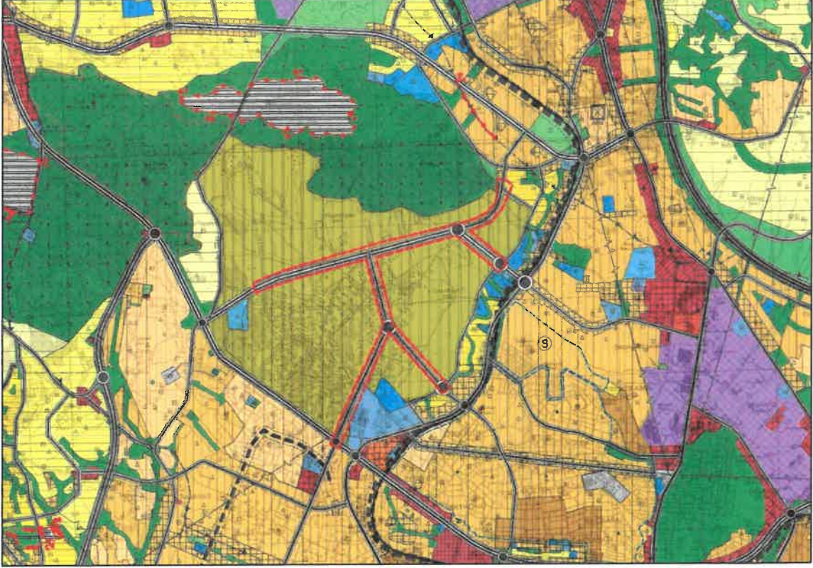
Şekil 2: Mevcut 1/25000 Ölçekli Nazım İmar Planı

Bahse konu alan mevcut 1/25000 ölçekli nazım imar planında imar yolları olarak görülmektedir.