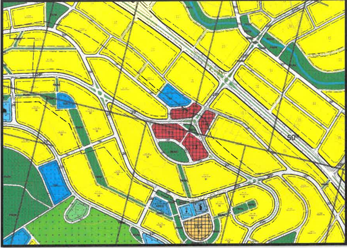
Şekil 2: Planlama Alanı Mevcut 1/1000 Uygulama İmar Planı