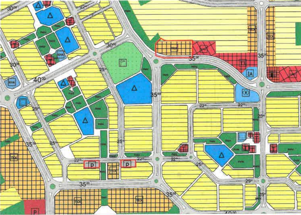
Şekil 2: Planlama Alanı Mevcut 1/5000 Ölçekli Nazım İmar Planı

Planlama alanları yürürlükteki 1/5000 ölçekli nazım imar planında ticaret-konut ve otopark alanı olarak görülmektedir.