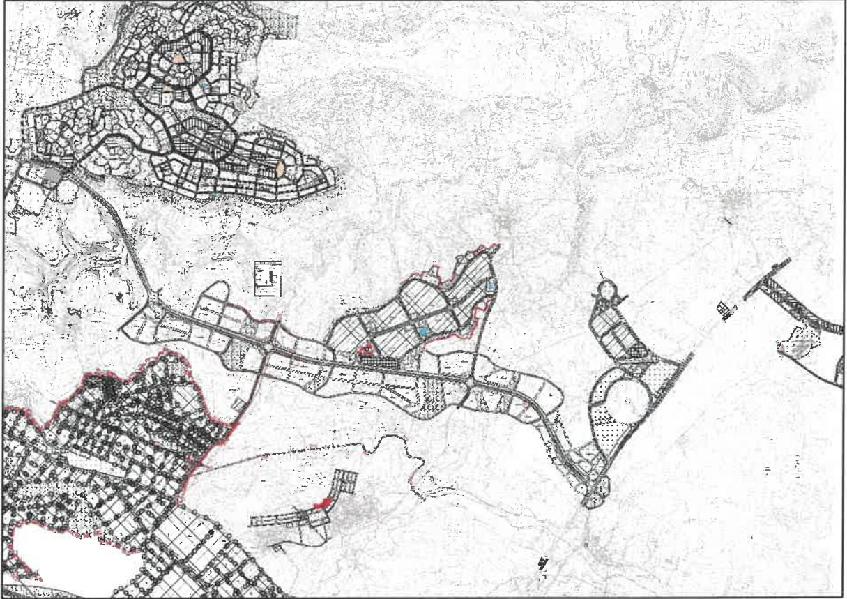
Şekil 4: Planlama Alanı Öneri 1/1000 Uygulama İmar Planı

Şehitkamil İlçesi Karacaören Yalangoz, Atabek, Övündük, Bedirkent ve Güngürge Mahalle sınırları içerisinde imar plan değişikliğine konu alanlar 1/1000 Ölçekli Uygulama İmar Planında 1/1000 Ölçekli Uygulama İmar Planında Konut Alanı, Belediye Hizmet Alanı (Büyükşehir Belediye Hizmet Alanı-Özel Yurt Alanı), Belediye Hizmet Alanı (Büyükşehir Belediye Hizmet Alanı-Teknik Hizmetler), Park Alanı ve İmar yolu olarak görülmektedir. Plan değişikliğine konu alanlarda sosyal altyapı dengesini iyileştirmek, uygulamada yaşanabilecek sorunların önüne geçebilmek ve artan enerji ihtiyacını karşılayabilmek amacıyla Konut Alanı (Ekolojik Tabanlı Konut), Ticaret Alanı, Yurt Alanı, Park Alanı, Trafo Alanı ve İmar Yolu şeklinde uygulama imar planı değişikliği hazırlanmıştır.