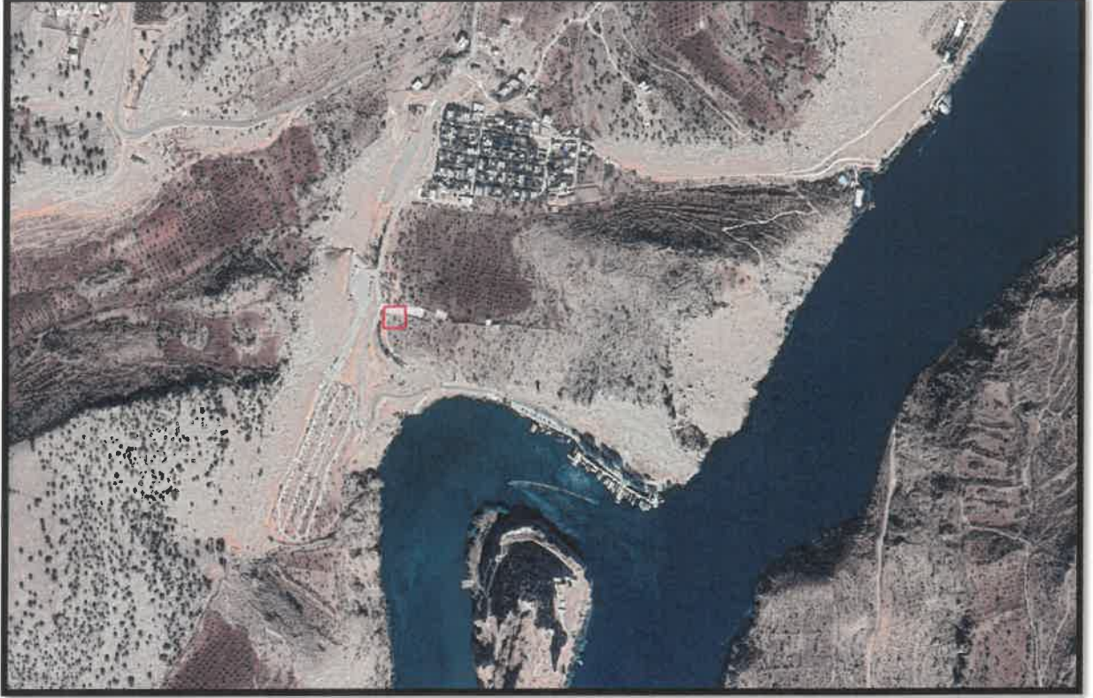
Şekil 1: Planlama Alanı Konumu

Gaziantep ili, Yavuzeli İlçesi, Kasaba Mahallesi sınırları içerisinde bulunan planlama alanı, Rumkale Cam Teras Tesisi'nin batısında yer almaktadır.