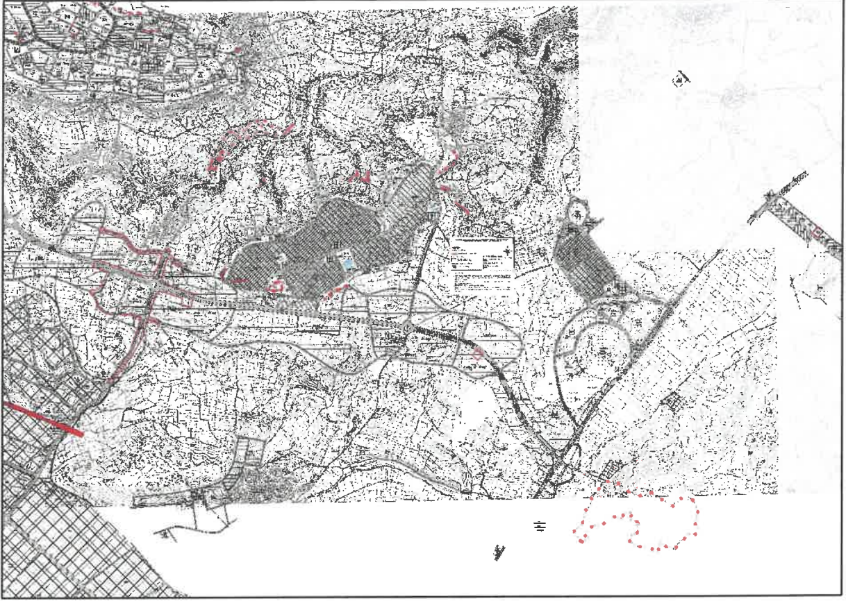
Şekil 5: Planlama Alanı Öneri 1/5000 Nazım İmar Planı