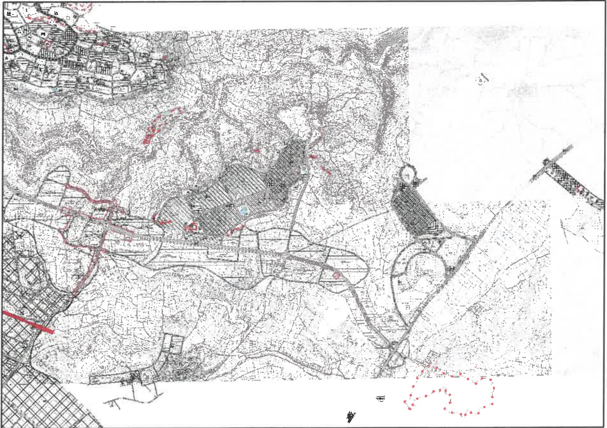
Şekil 3: Planlama Alanı Mevcut 1/5000 Nazım İmar Planı