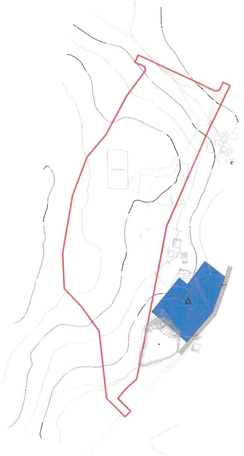
Harita 2: Mevcut 1/5000 ölçekli nazım imar planı

Planlama alanı mevcut 1/5000 ölçekli nazım imar planında plansız alan olarak görülmektedir.