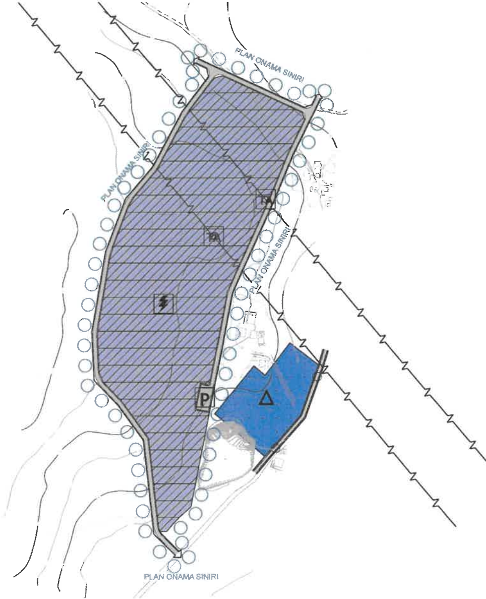
Harita 4: Öneri 1/5000 ölçekli nazım imar planı